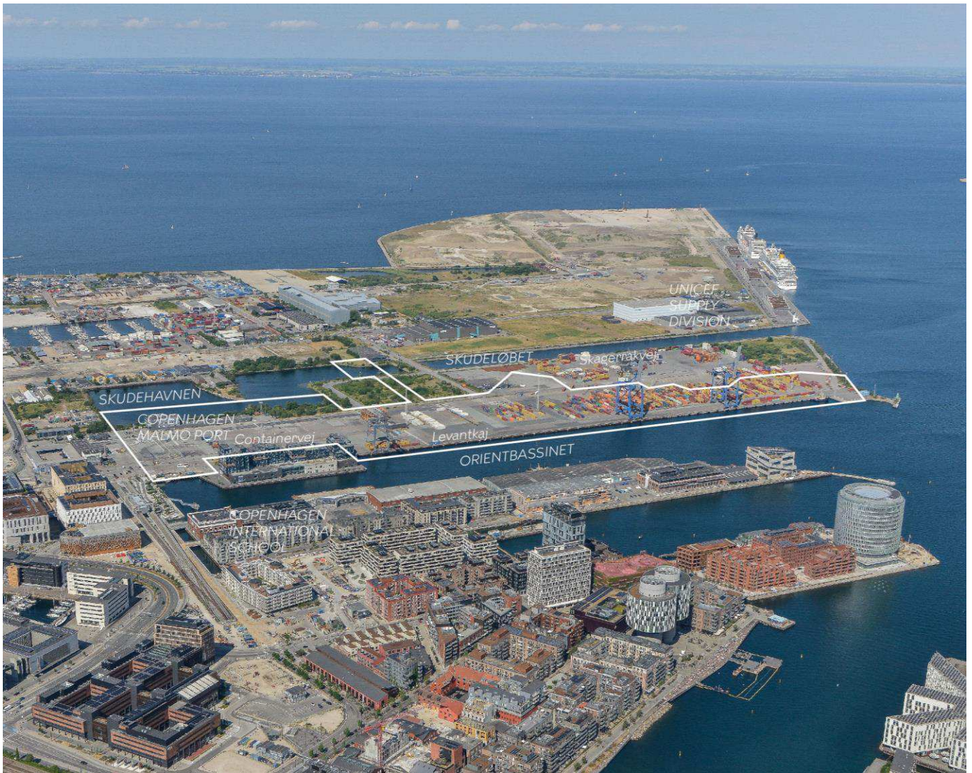
Luffoto af lokalplanområdet. Området udgør lidt over halvdelen af den fremtidige Levantkaj. Lokalplanområdet er indtegnet med hvid linje og de vigtigste gader og bygninger er navngivet.