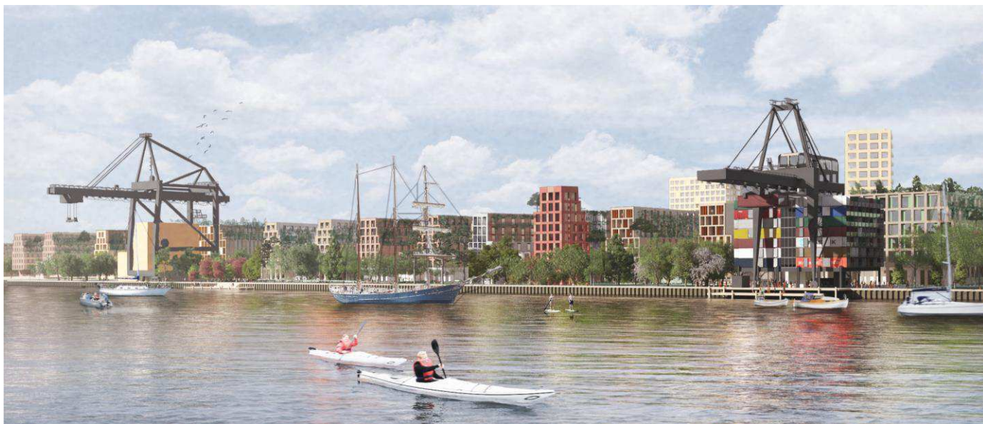
Visualisering, der viser et eksempel på nybyggeri mod Levantparken. Illustration: Entasis.