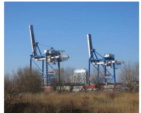
De markante containerkraner er vartegn for området.