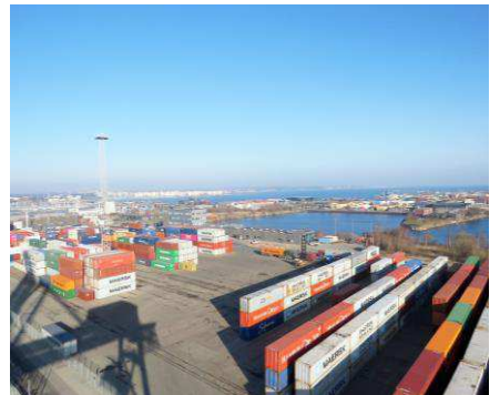
På den bare asfaltflade ses de farverige containere i snorlige rækker.