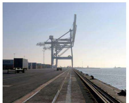
Kranspor og fortøjningspullerter langs den sydlige kajkant.