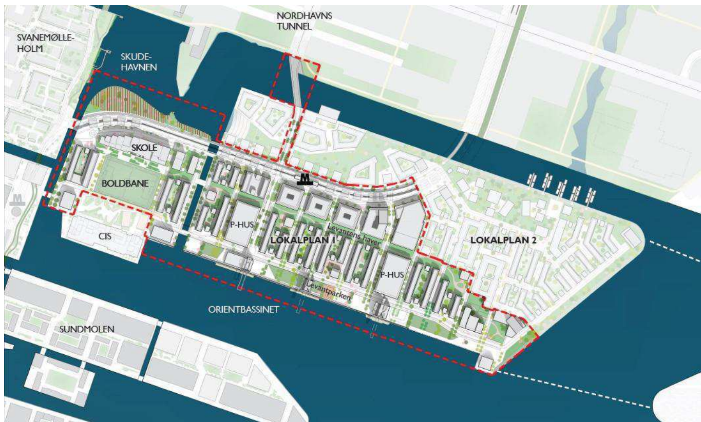
Foreløbig masterplan. Lokalplanafrænsningen for Levantkaj I er vist med rød stiplede linje og lokalplanafrænsningen for Levantkaj. Bebyggelsesplan og infrastruktur bearbejdes i den videre proces. Illustration: Entasis. TMF har på skitsen indtegnet to mulige bud på én mulig forbindelse til Lyntteholm samt bygherres forslag til opfyld i Skudehavnen, som er vist med rød skravering.