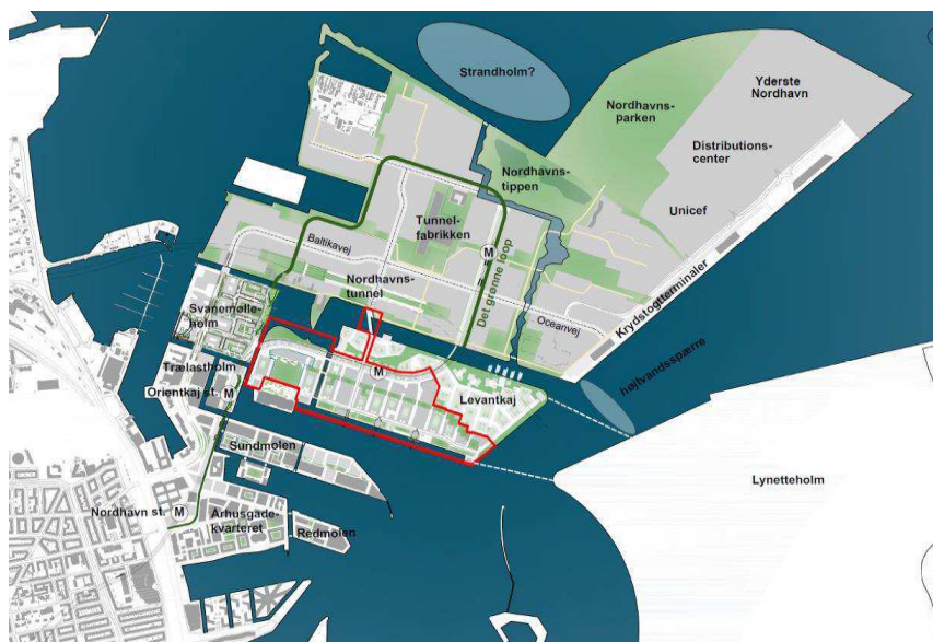
Strukturplan for Nordhavn 2023. Lokalplanafgrænsningen for Levantkaj I er vist med rød linje. Illustration: Cobe, Sleth og Entasis. TMF har på skitsen indtegnet to mulige bud på én mulig forbindelse til Lynetteholm.