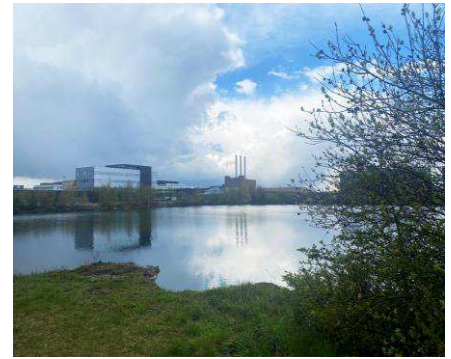
Skudehavnen er et atypisk vandrum i Nordhavn med grønne og bløde kanter.

Forvaltningen er i dialog med bygherre om områdets promenader og havnekanter således, at vandområdernes anvendelse får en sammenhæng med promenaderne, byrummene og bebyggelsen. Forvaltningen anbefaler i den forbindelse, at