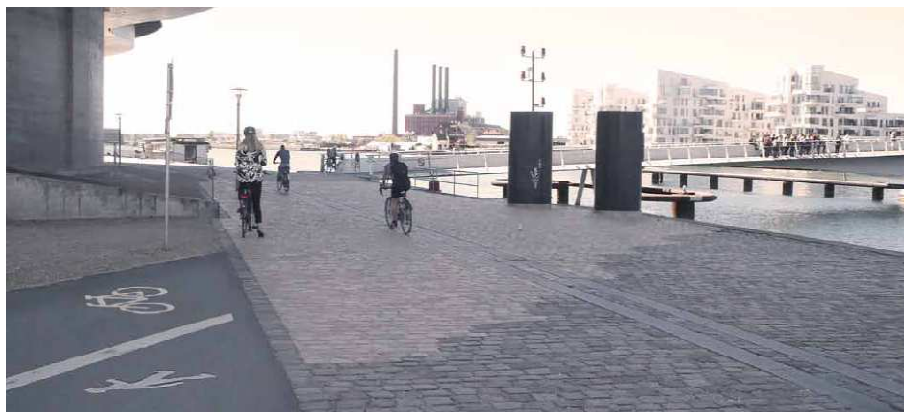
Foreløbig visualisering af løsning

Løsningen for arealet består i at udskifte et større areal af de eksisterende brosten imellem Bryggebroen og Aksel Heides Plads. De kløvede brosten udskiftes med nye savskårne og stokhuggede brosten. Der udskiftes så bredt et areal at både gående og cyklende vil kunne færdes på det. På Aksel Heides Plads, byttes der rundt på cykel og fodgænger symbolerne, så de 2 færdselsgrupper ikke længere behøves at krydse hinanden for at komme ”rigtigt” ind på Bryggebroen. Se skitse side 2.