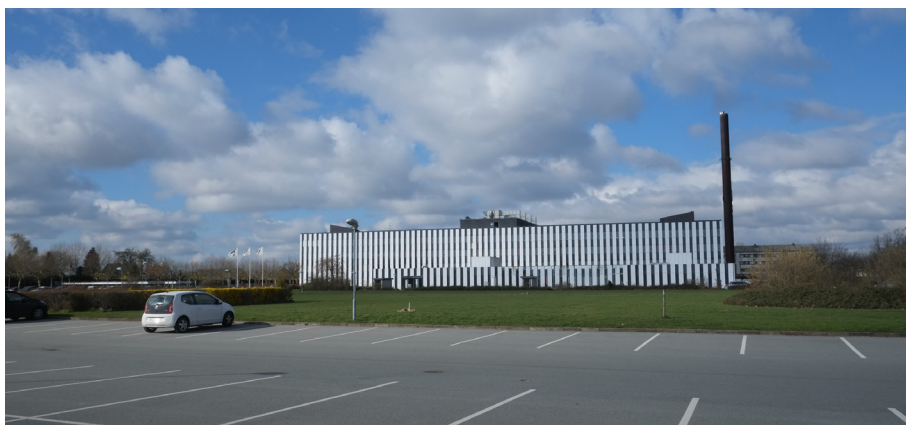
DXC set fra parkeringsarealet ved Retortvej. Foto: Arkitema