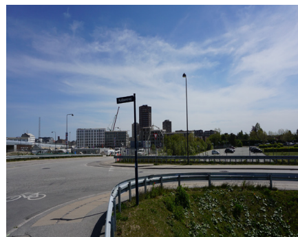
Kulbanevejs udmunding i Retortvej med grønttorvsområdet i baggrunden. Kulbanevej forudsættes nedlagt på dette sted. Foto: Arkitema