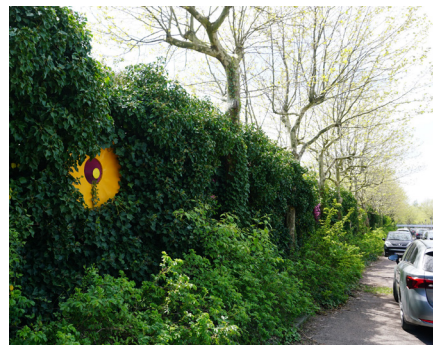
Grøn hegning ved skel mod villaområdet mod syd.

Med placering og højde af bygningerne er der taget hensyn til sikring af gode lysforhold i såvel boliger som på opholdsarealer. I det videre arbejde skal det sikres, at eventuelle gener på grund af vindpåvirkning i åbninger mellem bebyggelser forebygges ved hjælp af hensigtsmæssig placering af træer og anden beplantning.