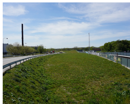
Det kommunale areal set mod vest med Ringstedbanen til højre og Kulbanevej til venstre. Foto: Arkitema