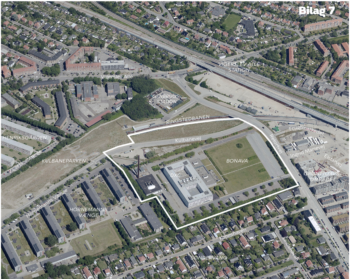
Området set mod nord. Lokalplanområdet er indtegnet med hvid linje og de vigtigste gader og bygninger er navngivet. Luftfoto: Kortforsyningen, 2019.