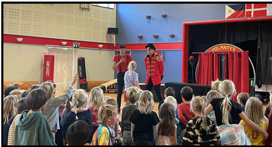
Volantes Compagny åbnede festivalen med forestillingen Slabam for 300 børn i Multihallen Kofoed Skole

Følgende ses på kommunikation, indhold og arbejdet med et tema for festivalen samt samarbejdet.