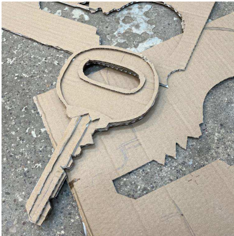
Skitse, skåret ud af pap fra flyttekasse