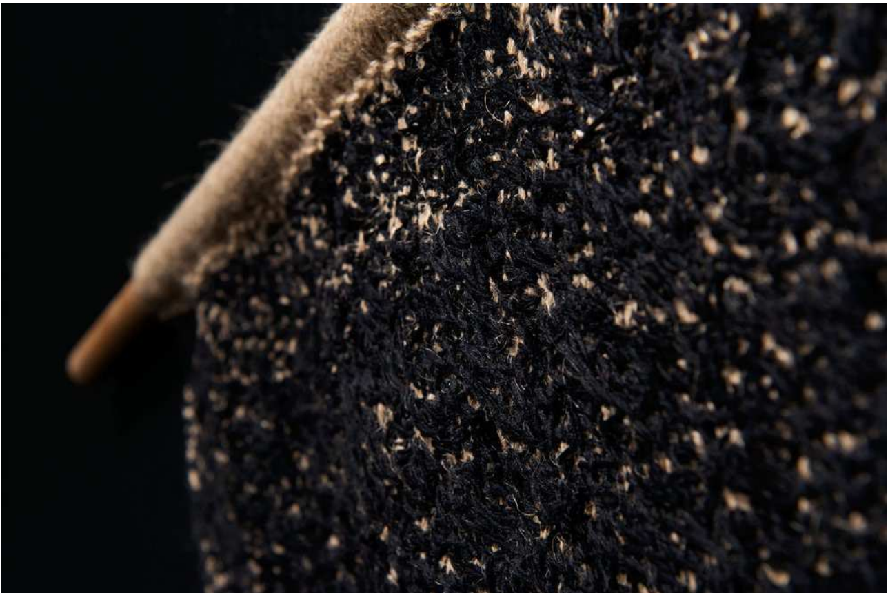
Natural History , 2014. Tre tekstilværker. Installationsfoto, udstilling hos Intermedia, Centre for Contemporary Art Glasgow.