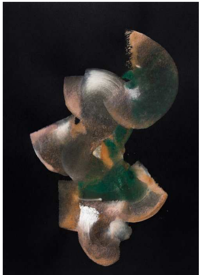
Fra serien The Jazz Years , 2018. Goache og farveblyant på papir, 42 x 29,7 cm.