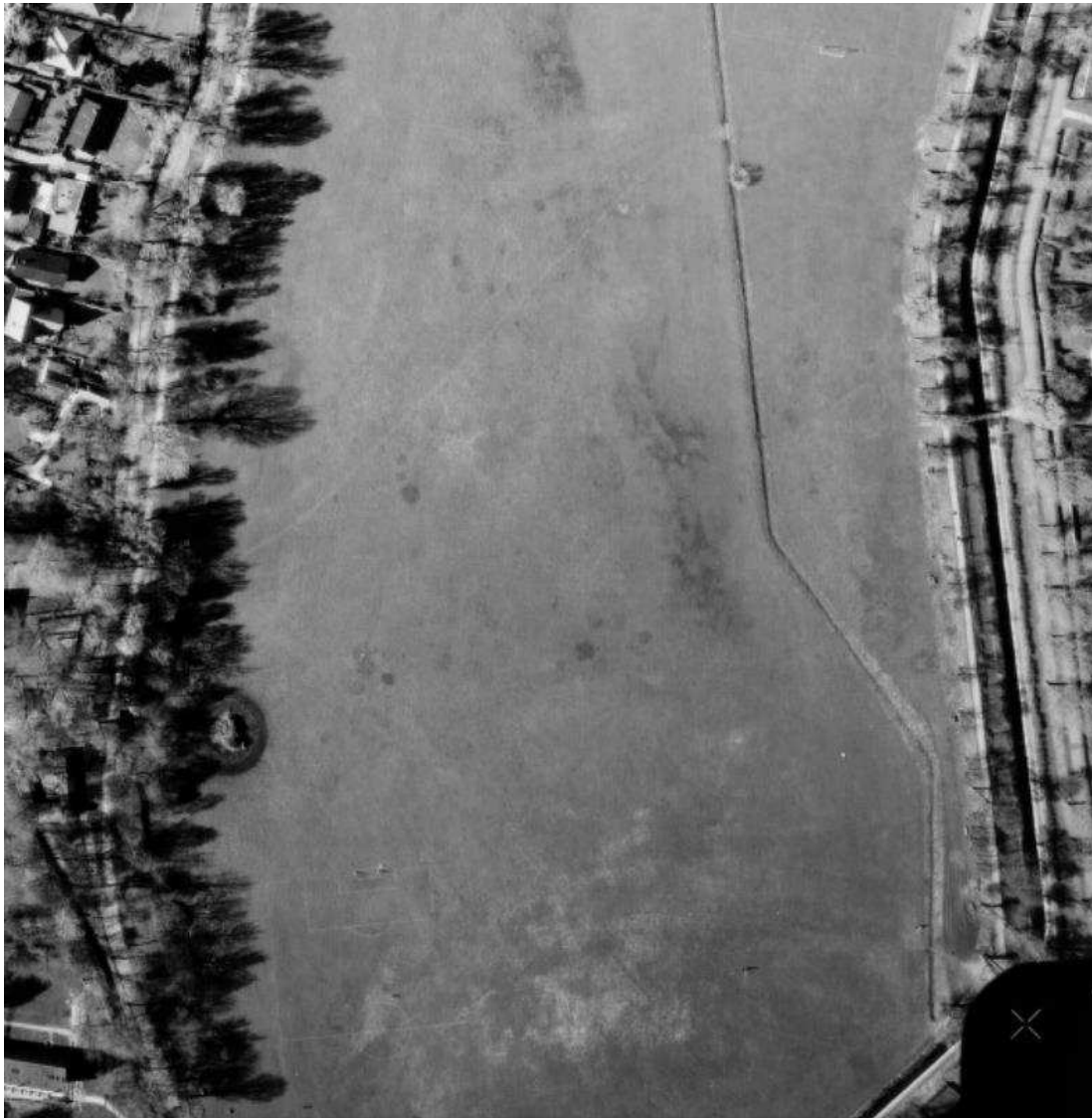
Figur 3 Luftfoto 1982. Også her ses spredte boldbaner med forholdsvis ensartet vegetation imellem, dog med flere fugtige partier især i den vestlige del.