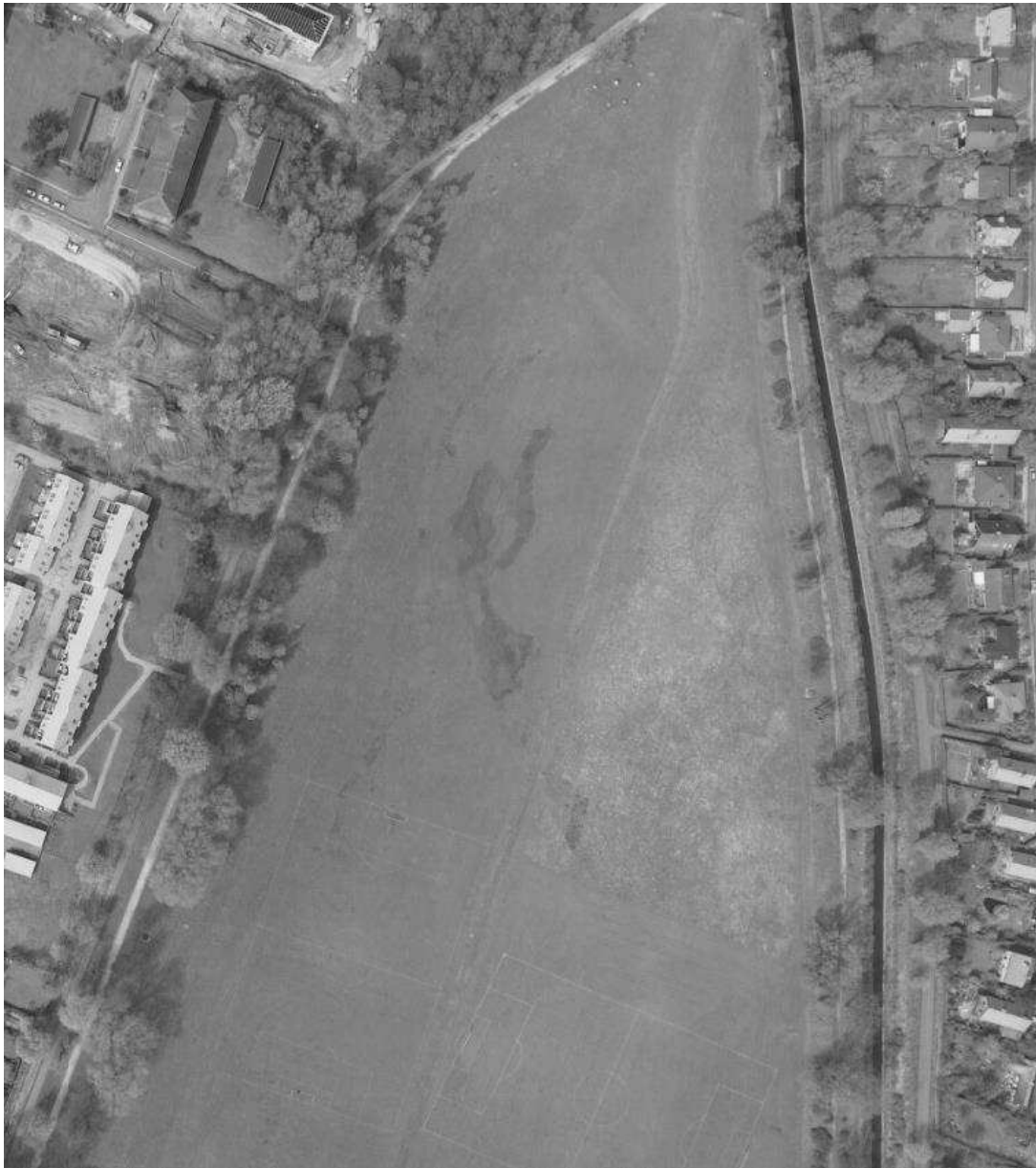
Figur 6 Luftfoto 1989. På billedet ses kortklippet vegetation med fugtige partier i den vestlige del af det nuværende § 3-område, men noget mere høj vegetation i den østlige del.