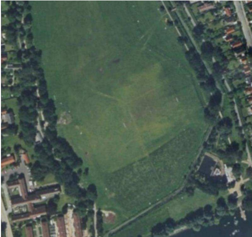
Figur 2 Luftfoto 1995. På den sydlige del af engen, kan der ses optegninger til en boldbane og generelt et meget monotont vegetationsbillede.