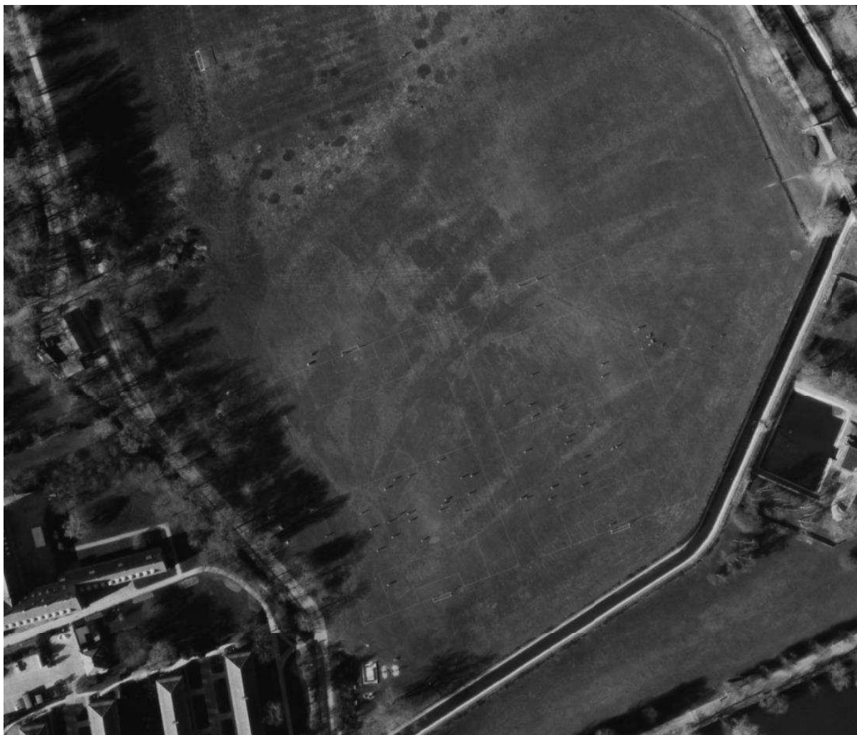
Figur 4 Luftfoto 1978. Det meste af den sydlige del af engen bruges som boldbaner. Billedet viser de optegnede baner med spillere på banen.

Billederne viser tydeligt, at store dele af den sydlige del af engen har været anvendt og plejet som boldbaner op igennem 70'erne og 80'erne samt til en vis grad stadig i 1995. Der kan derfor ikke have været engvegetation, som lever op til kravene for at være omfattet af NBL § 3 pr. 1. juli 1992.