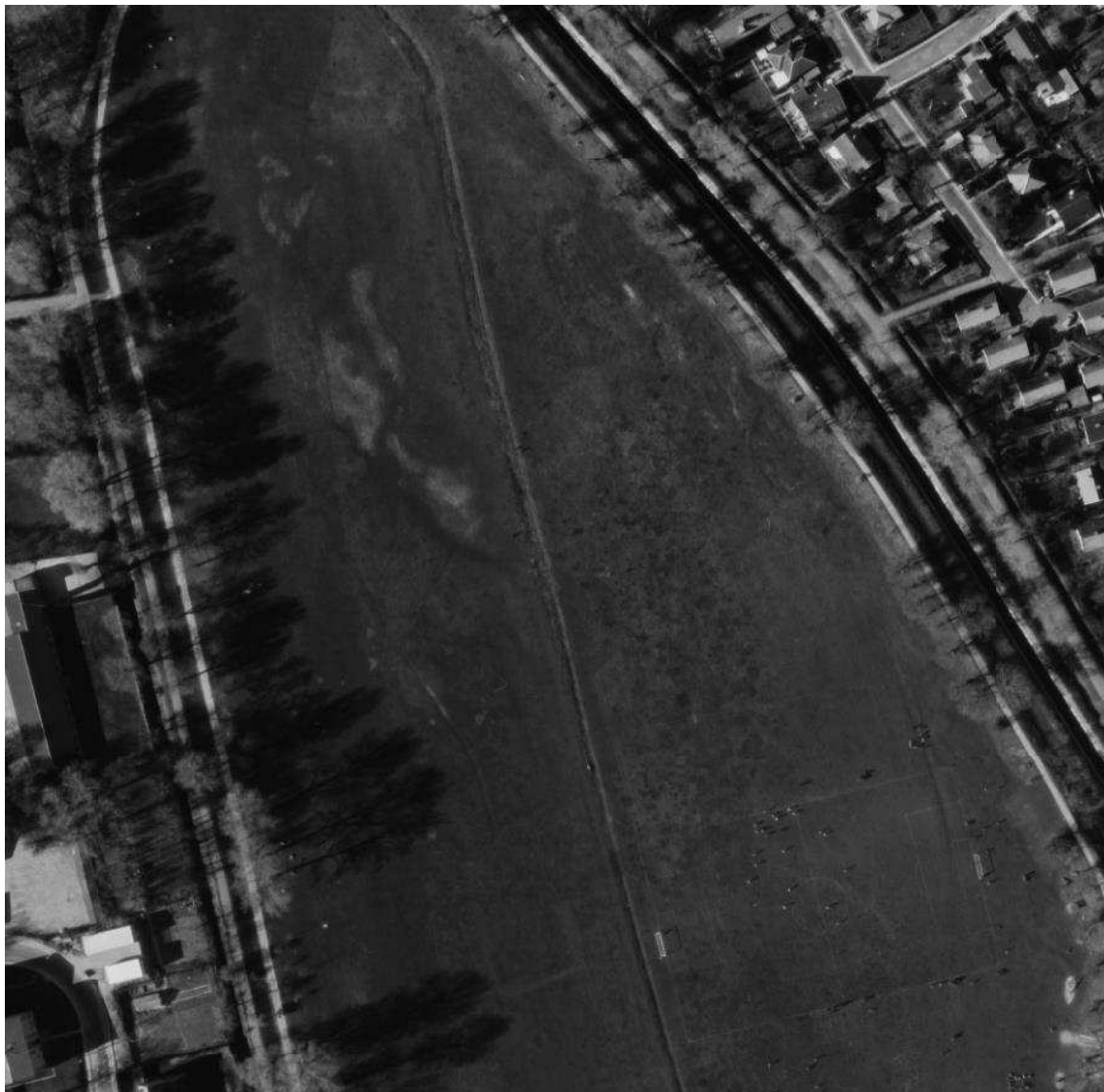
Figur 7 Luffoto 1978 af den nordlige del af engen. Der ses en boldbane i den sydlige del af billedet, men et noget mere varieret vegetationsbillede i den nordlige del, med fugtige partier.

Anvendelsen og plejen af den nordlige del af engen ser ud til at have varieret over tid, ligesom i den sydlige del. Der er dog på alle tre billeder høj vegetation i den østlige del og fugtige partier i den nordlige del. Det er ikke muligt at nå frem til en entydig konklusion om hvorvidt der har været eng på hele eller dele af det nordlige nuværende § 3-område i 1992. Da arealet først i 2012 blev kortlagt som § 3-område, og dengang blev beskrevet som værende i dårlig tilstand med ensformig vegetation, vurderes det alligevel at være usandsynligt, at der var engvegetation i 1992.