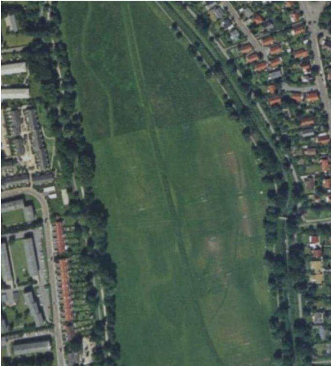
Figur 5 Luftfoto 1995. Også de centrale dele af engen bruges som boldbaner, hvorimod den nordlige del ses med mere vildtvoksende, dog ensartet vegetation. Billedet svarer her nogen lunde til det, vi ser i dag.