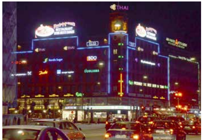
Det er vigtigt, at de forskellige reklamer og skilte indordner sig i en helhed uden at overdøve hinanden.