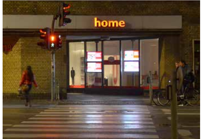
Eksempel på skærme i et butiksvindue.

Projicering af lysbilleder må kun ske ved helt særlige begivenheder af generel interesse for byen og kun på bygninger, der ikke benyttes om natten - og kun med ejerens tilladelse.