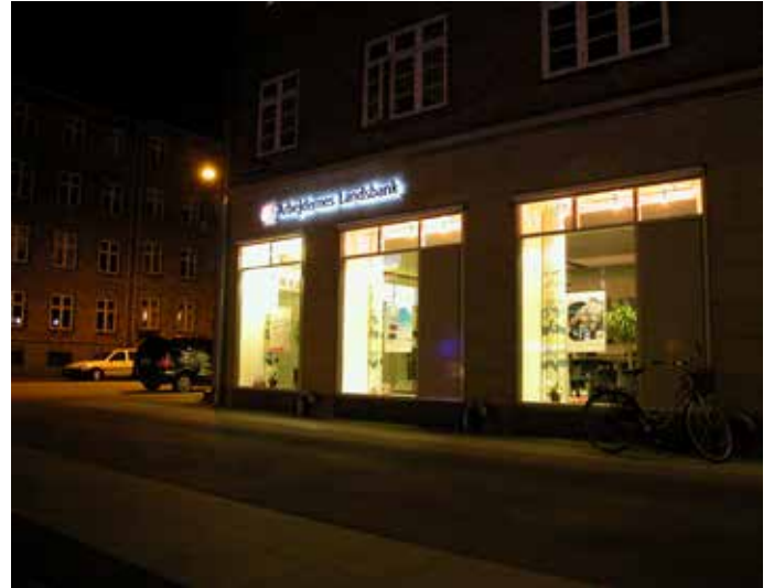
Skiltebelysning med coronaeffekt (bogstaver, der er belyst bagfra) løser på fin måde eventuelle blændingsproblemer.