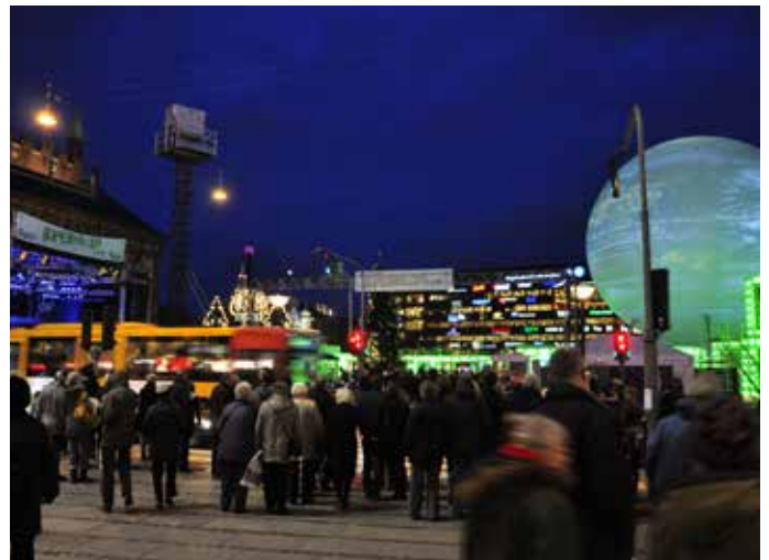
Reklameballon tillades kun undtagelsesvis i forbindelse med særlige events.