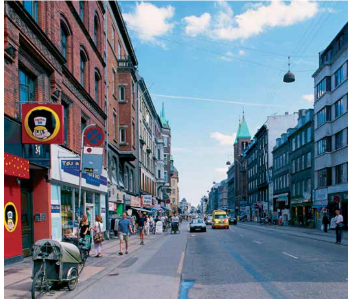
Brokvarterenes strøggader er præget af et livligt butiksliv.

Mange reklamer samlet - særlig lysreklamer - kan være med til at markere knudepunkter i byen fx byrum, trafikknudepunkter og større indkøbscentre.