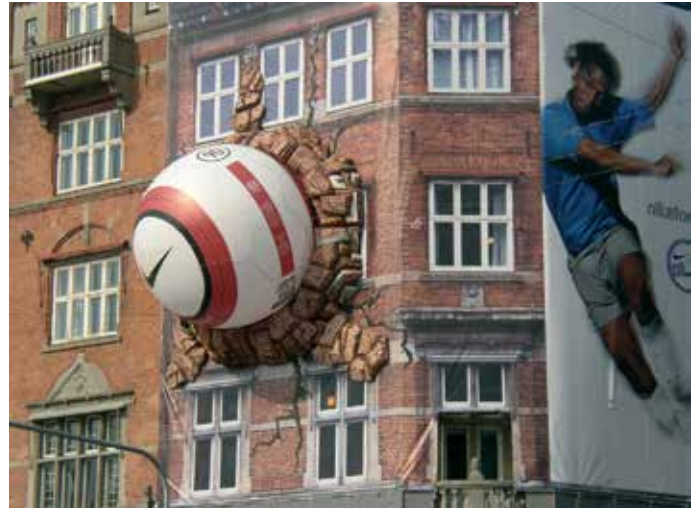
Reklameduge tillades generelt ikke. Reklameduge tillades kun på stilladser i forbindelse med renovering af facader og tage.