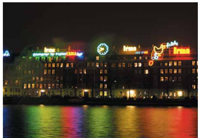
Reklamer er med til at sende et signal om en dynamisk og levende by og kan give et festligt indslag - ikke mindst lysreklamerne i byens nattebillede.

give anledning til gener i forhold til annoncører, brugere og omboende. Det vil fremgå af godkendelsen, hvilke specifikke krav lysreklamen skal opfylde med hensyn til udformning og funktion.