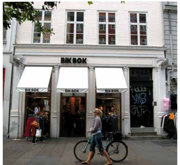
Markiserne her respekterer bygningens fagdeling. Skiltning sker på markisekanten.