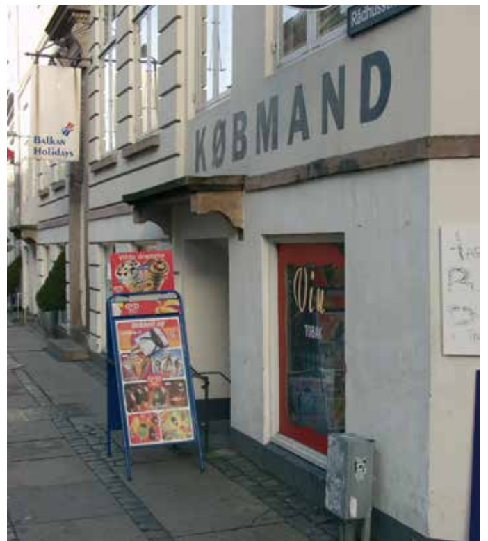
Skilteudstyr placeret på fortovsareal bør generelt begrænses af hensyn til fremkommeligheden.