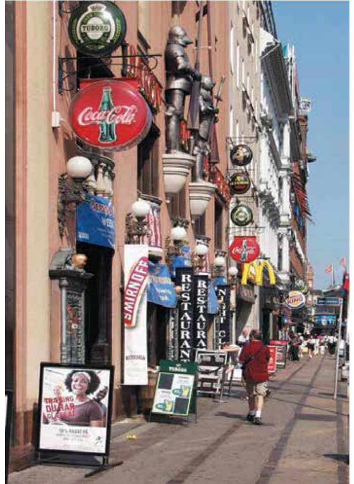
For mange skilte kan virke forvirrende på kunderne.

I forbindelse med tilladelser vurderes ansøgningen ud fra det konkrete sted, hvor byliv, trafik, antal af boliger, hensynet til bevaringsværdier og rekreative/grønne områder spiller en rolle.