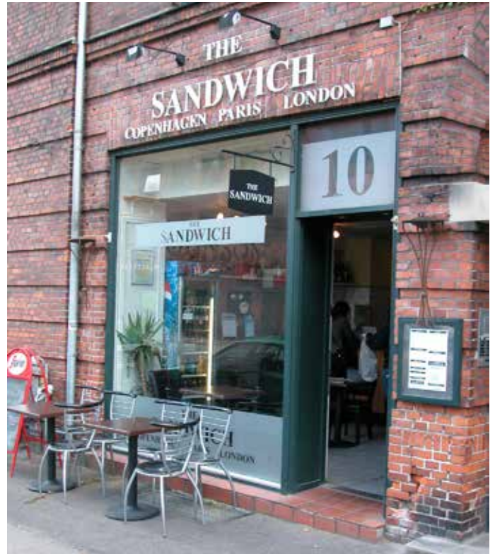
Her har man opnået en fin harmoni mellem skiltningen og bygningens facade med dens materialer og detaljer.