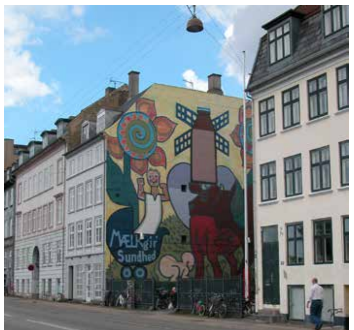
Heerups kendte mælkeklame, Sølvgade.