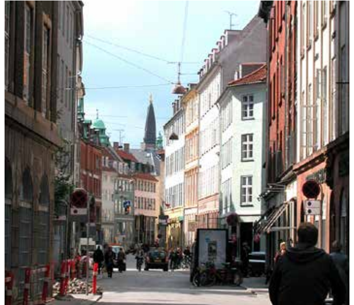
Snævre gaderum med diskrete facader giver ringe mulighed for reklamering.

Gågaderne i Indre By er livlige handeleggader, og reklamer er en del af gadebilledet.