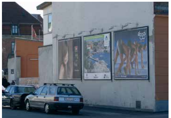
Billboards kan opsættes på brandgavle i industriområder og på byggepladshegn.