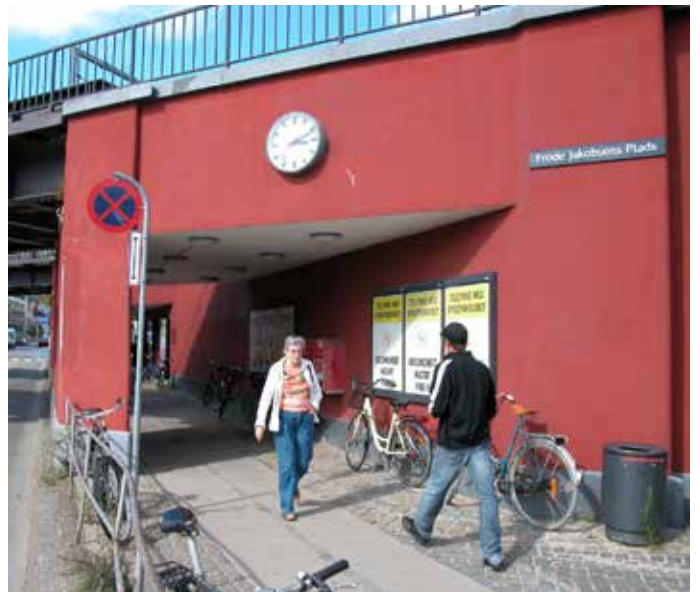
Belyste reklameskabe i gangrumarealer kan virke tryghedsskabende.