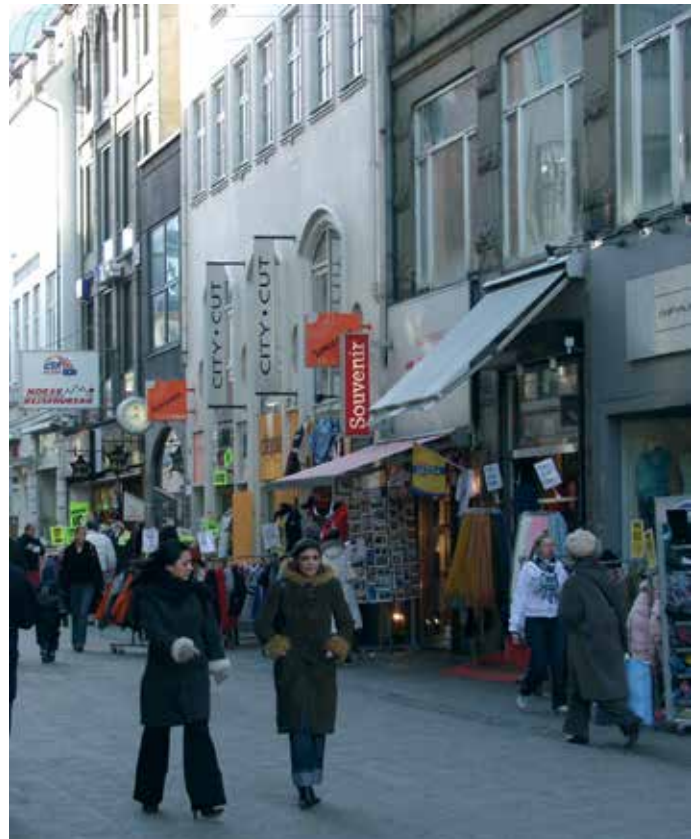
Skiltningen i den Indre By skal tilpasses byens mindre skala og må ikke sløre bygningens facader.