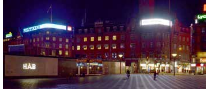
Lysviserne ved Rådhuspladsen er et bidrag til stedets puls. Det er afgørende, at især de digitale lysreklamer reguleres efter lysforholdene om dagen og om aftenen.