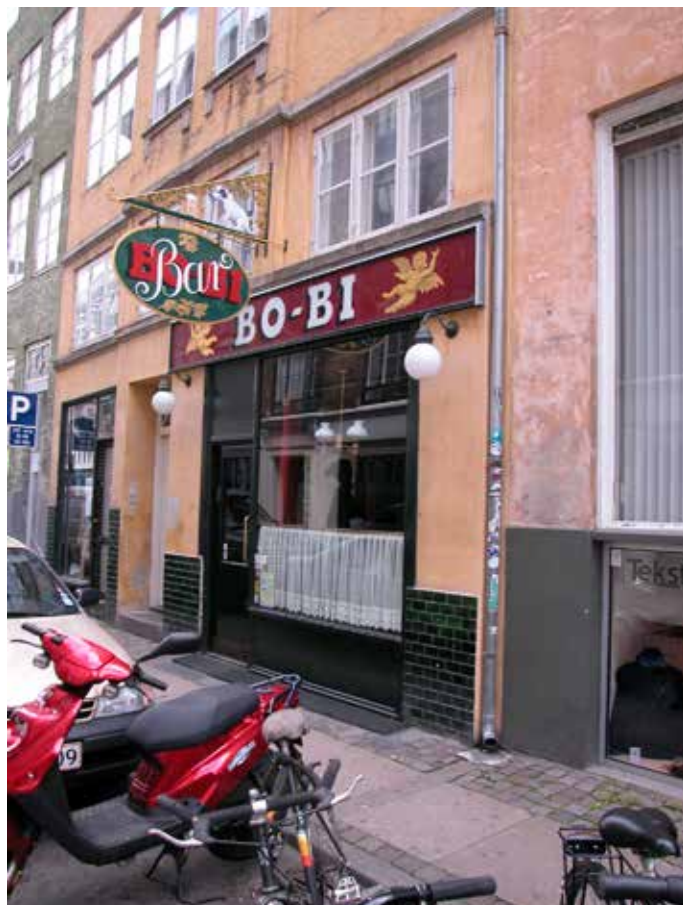
Skiltningen formidler på en enkel måde, hvad der forhandles, samt butikkens navn på en måde som er fint tilpasset kvarterets arkitektur.

Det er afgørende for en god skiltning, at forbrugeren ikke forvirres af for mange informationer. Skiltningen skal derfor være enkel, klar og tydeligt formidle, hvad der forhandles. Skiltningen må gerne være fantasifuld og af høj kvalitet, hvad angår design og udførelse.