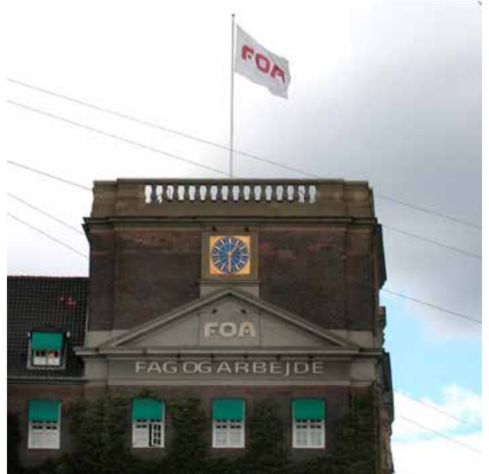
Det er tilladt at flage med firmalogo som her på hustage.