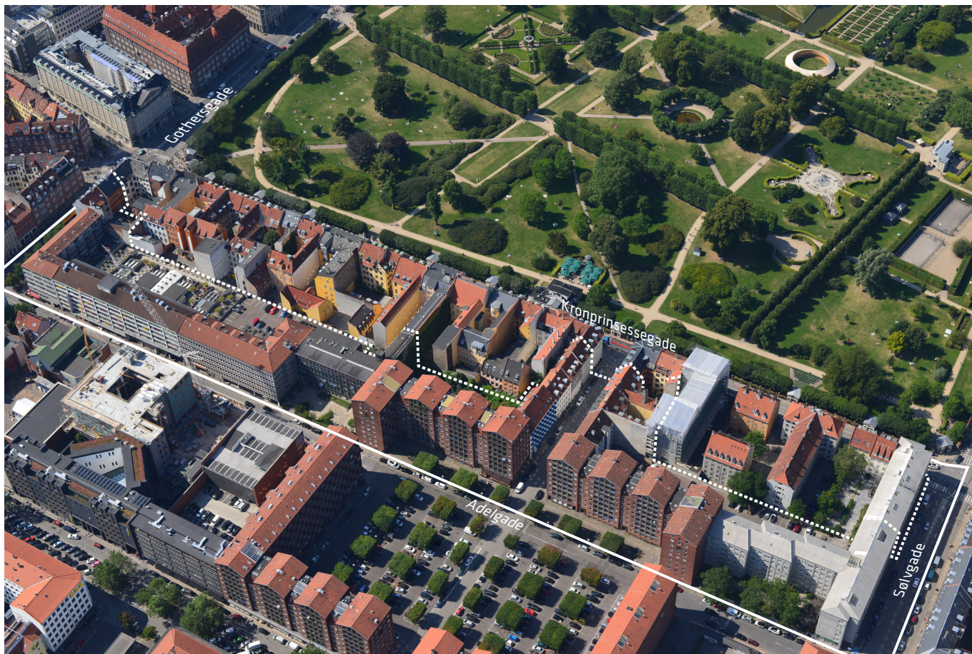
Luftfoto af området set fra øst. Lokalplan nr. 323 er angivet med hvid linje. Området for tillæg nr. 1 er angivet med hvid, stiplede linje.