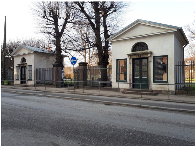
Pavilloner i Kongens Have

Området ligger i den kystnære del af byzonen. På grund af den betydelige afstand samt de mellemliggende bebyggelser og anlæg opfattes området imidlertid ikke som en del af kysten. En visualisering i forhold hertil er derfor ikke påkrævet.