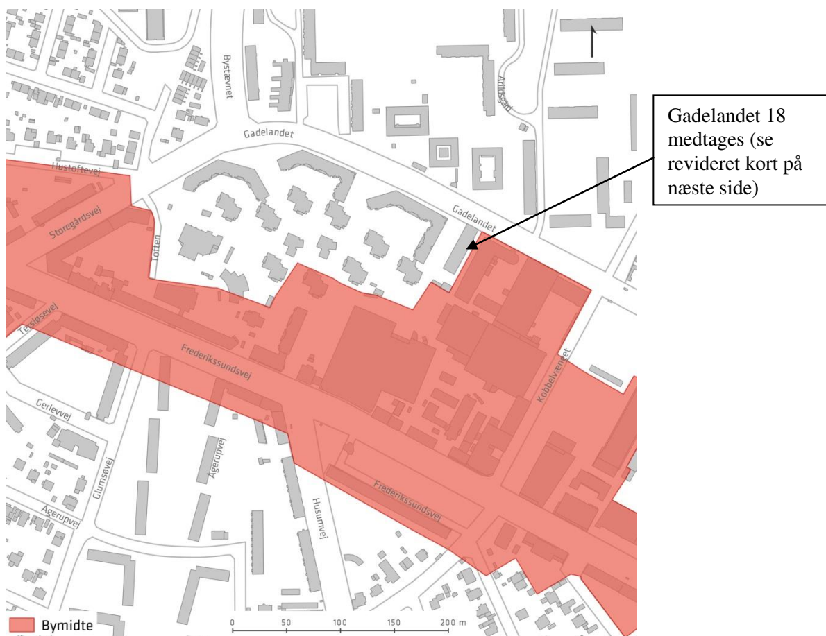
Kort B: Forslag til ændrede detailhandelsrammer

Følgende kort i kommuneplantillæg på side 42 ændres fra: