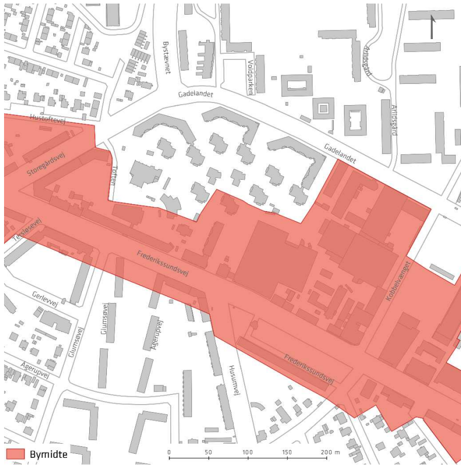
Kort B: Forslag til ændrede detailhandelsrammer