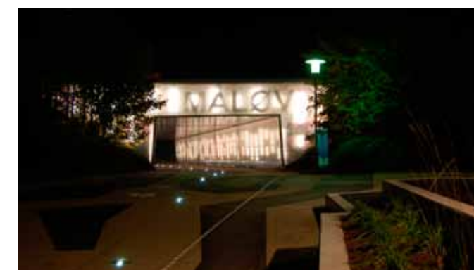
Belysning og synlighed