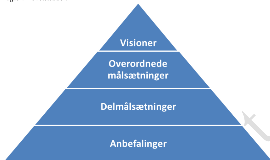
Figur 1: Målhierarki for planlægning og udvikling af almen praksis 2015-2018 i Region Hovedstaden