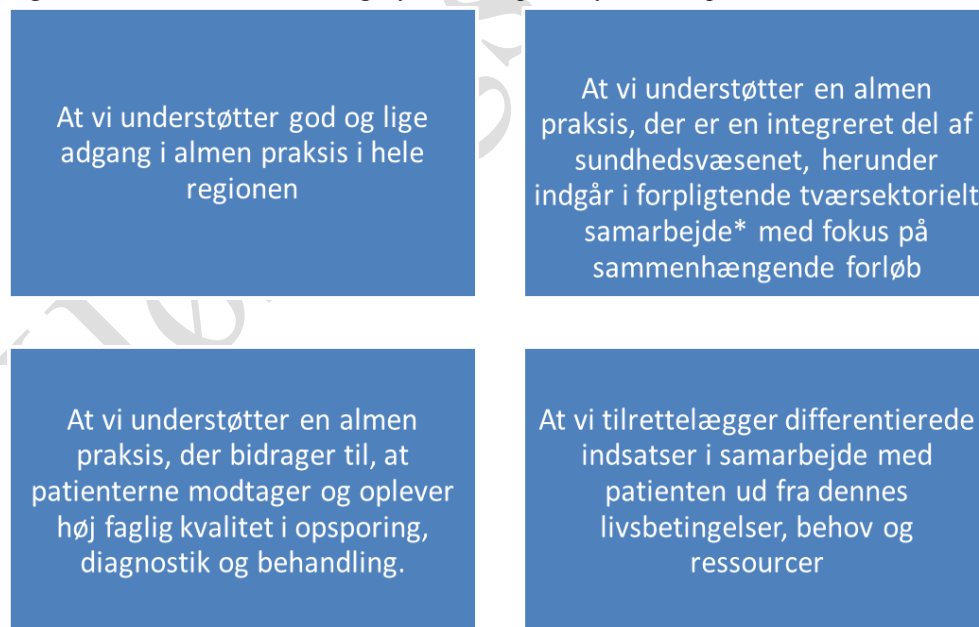
Figur 2: Overordnede målsætninger for Praksisplanen for almen praksis 2015-18

*Almen praksis' forpligtelser konkretiseres i den underliggende aftale i det omfang, det ikke er en del af de overenskomstmæssige forpligtelser.