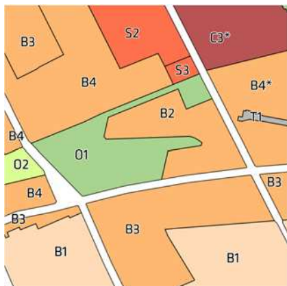
Rammer for Kommuneplan 2015

Kommuneplan 2015 udlægger boligområdet til boliger (B2) og parken til offentlige formål, fritidsområder (O1).