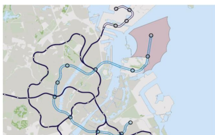
M5 Vest: Lynetteholmen - Prags Boulevard

To nye linjeføringer er screenet og vurderet ud fra en række vurderingsparametre omfattende bl.a. restfinansiering, passagertal, kapacitet, byudvikling, robusthed, rejsetid mv. På baggrund heraf, er metrolinjen M5 Vest udvalgt til at indgå i forundersøgelsen. Linjeføringen for M5 Vest føres på højbane på Lynetteholmen og Refshaleøen, hvorefter den føres i boret tunnel til Prags Boulevard. Der undersøges placering af station ved Prags Boulevard tættere på Kløverparken, for at opnå bedre dækning heraf. M5 Vest fremgår af kortet herunder.