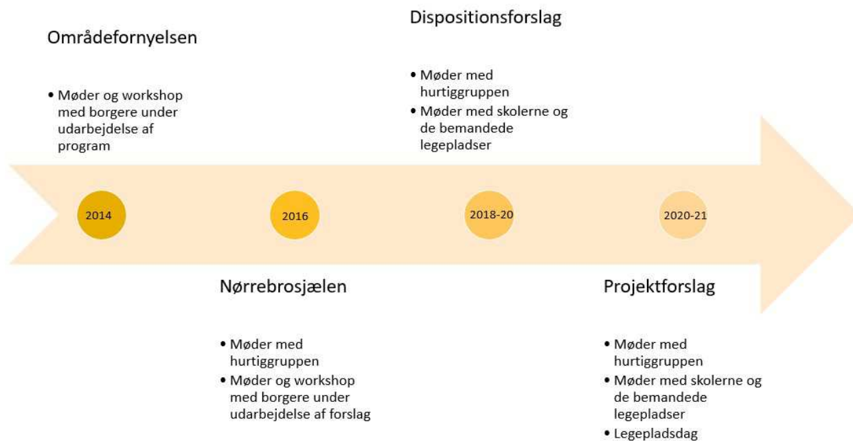
Figur 2 - Oversigt over inddragelse af borgere og interessenter i Hans Tavsens Park projektet.

eleverådets kommentarer. Desuden deltog en medarbejder fra indskoling, som blandt andet kom med vigtige input om elevernes behov for at krydse Mellemlummet i skoletiden.