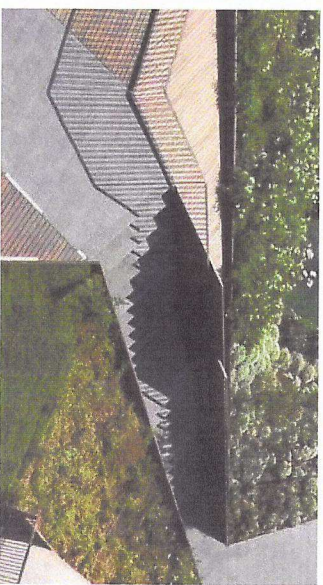
På sydsiden kan terrænet skæbne med mulighed for ophold mod boligkerne og de små gader, hvor der kan laves sivegade med mulighed for leg.