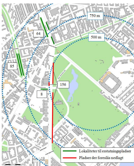
Fig 1 Afstande i nærområdet

På grund af naboskabet til Fælledparken, Rigshospitalet og Nørre Campus, vil nærmeste mulighed for at finde erstatningspladser i Blå zone ligge i en afstand af op til 500 m fra de nedlagte p-pladser. Mulighederne for at finde ikke udnyttede pladser i Blå zone i Nørre Campus, er meget små, og at oprette erstatningsparkeringspladser med henblik på at løse event-parkering i Guldbergsgade kvarteret, vil formentlig udløse negative beboerreaktioner.