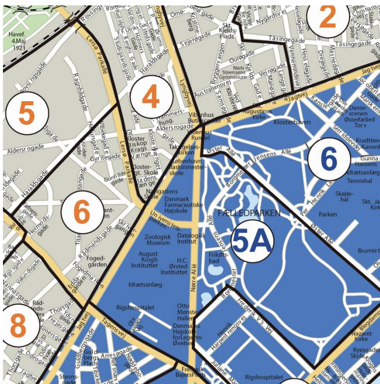
Fig. 3 Berørte zoner