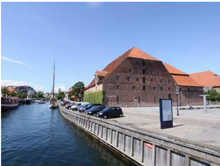
Bryghuset set fra Christians Brygge.