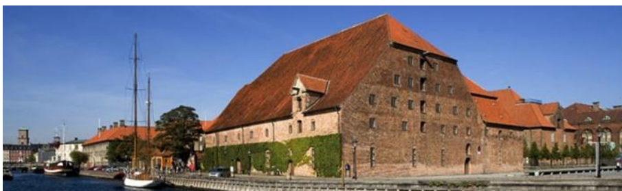
Bryghuset set fra Frederiksholms kanal.

Københavns Museum vil i Christian IV's Bryghus få en perfekt og mere synlig beliggenhed i centrum af København med mulighed for at indgå i byens kulturelle og historiske akse på Slotsholmen. I Chr. IV's Bryghus vil museet få væsentligt mere plads til udstillinger mv.