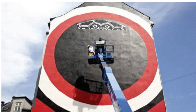
RIP. Den verdenskendte billedkunstner Shepard Fairey betegner sig selv som fredsaktivist. I går skabte han kunst på Ungdomshusets tidligere adresse i håb om, at den måtte hvile i fred.

Amerikansk kunstner forvandlede i går den ryddede grund til et kunstværk.