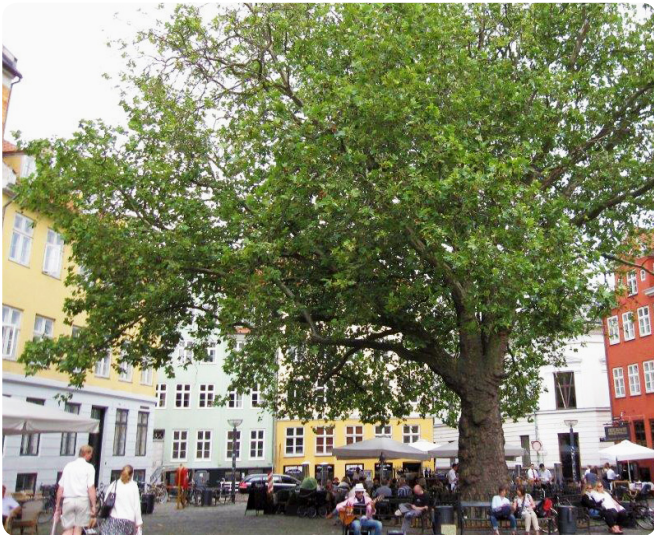
På Gråbrødretorv står et gammelt Platantræ, der er identitets-skabende for torvet.