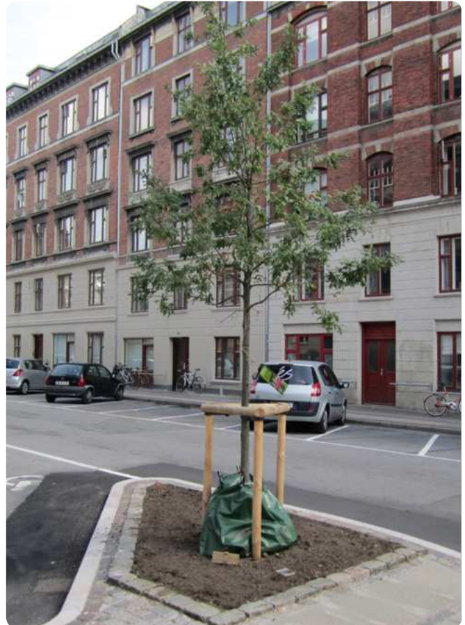
Eksempel på udnyttelse af byens rum til plantning af et nyt træ i et boligkvarter.