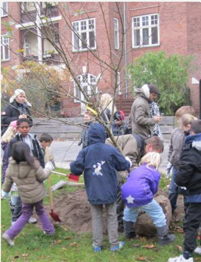
Skolebørn planter 'deres træ' i samarbejde med en gartner fra Teknik- og Miljøforvaltningen.