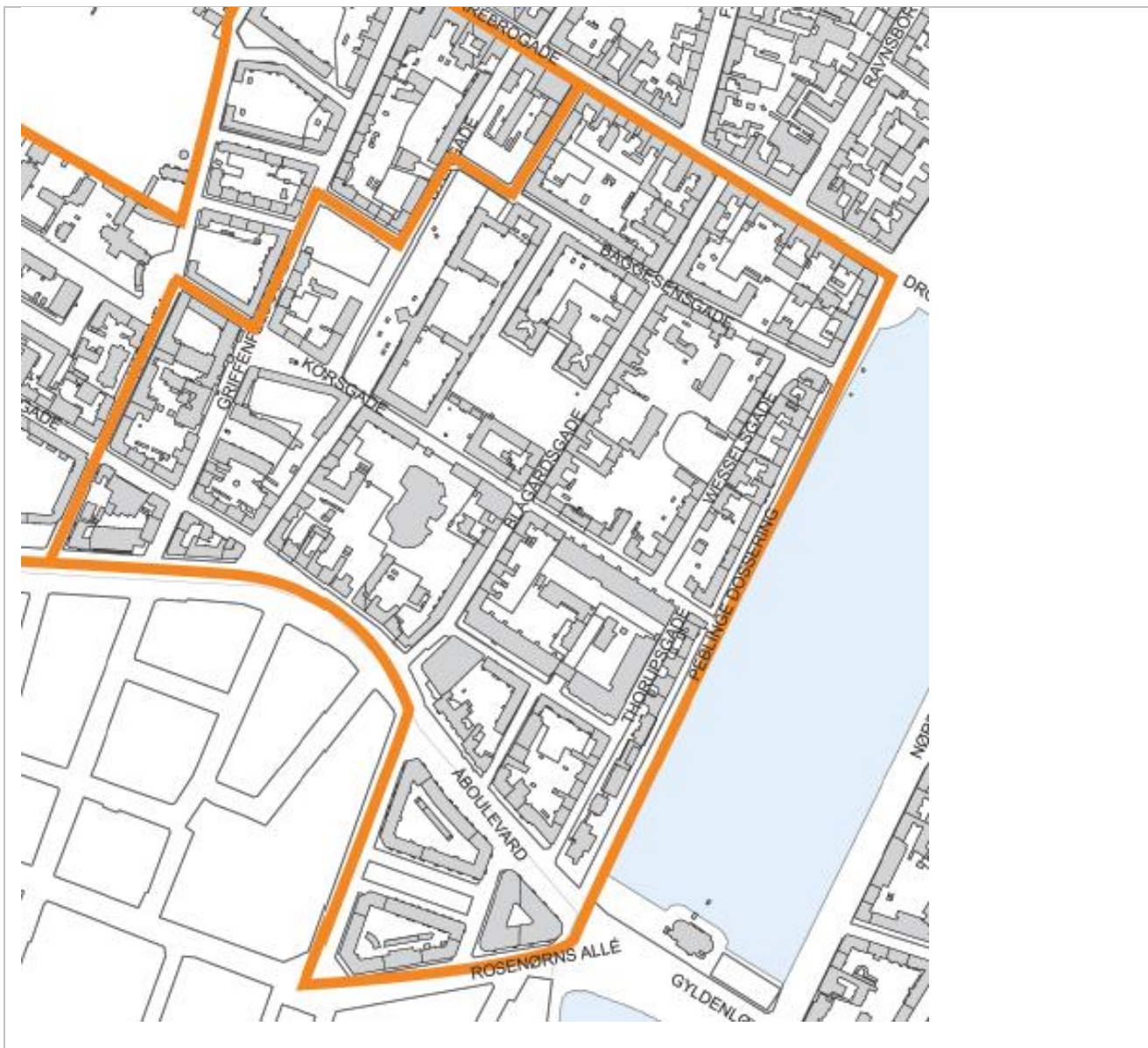
Kort over Blågårdskvarteret

Hvad er begrundelserne for den valgte geografiske afgrænsning af byområdet (f.eks. særlige landskabelige karakteristika, byområdets rolle i byen m.v.)