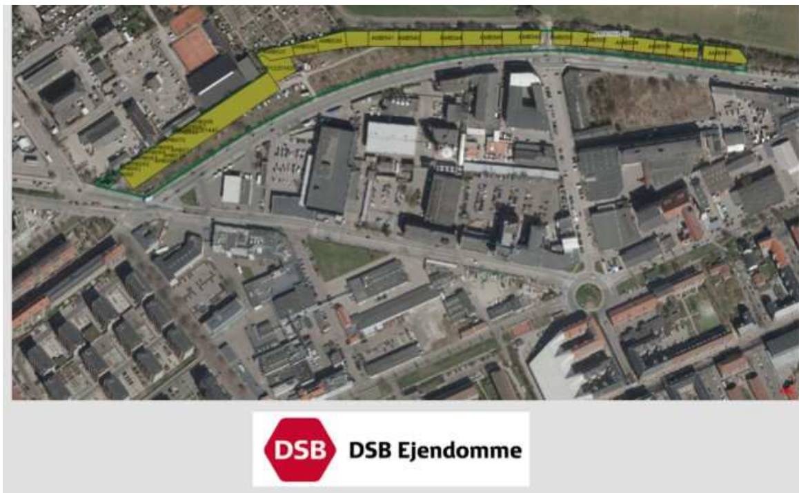
Bilag 1. Ejerforhold 2018. Den grønne streg markerer grunden.