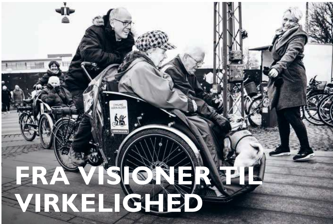
Vind i håret på passagererne i rickshaw fra Plejecentret Damsøgaard.

De kommende fire år skal Københavns Kommune omsætte visionerne i ældrepolitikken til konkrete forbedringer i indsatsen for de ældre. Det ansvar skal først og fremmest løftes af Sundheds- og Omsorgsforvaltningens mange kompetente medarbejdere og ledere, men det skal også løftes af københavnere. Som borgere, brugere og pårørende skal københavnere i fællesskab med kommunen være med til at skabe de gode løsninger. For at nå ældrepolitikens mål sammen, må vi konkret arbejde med tillid, faglighed og partnerskaber.