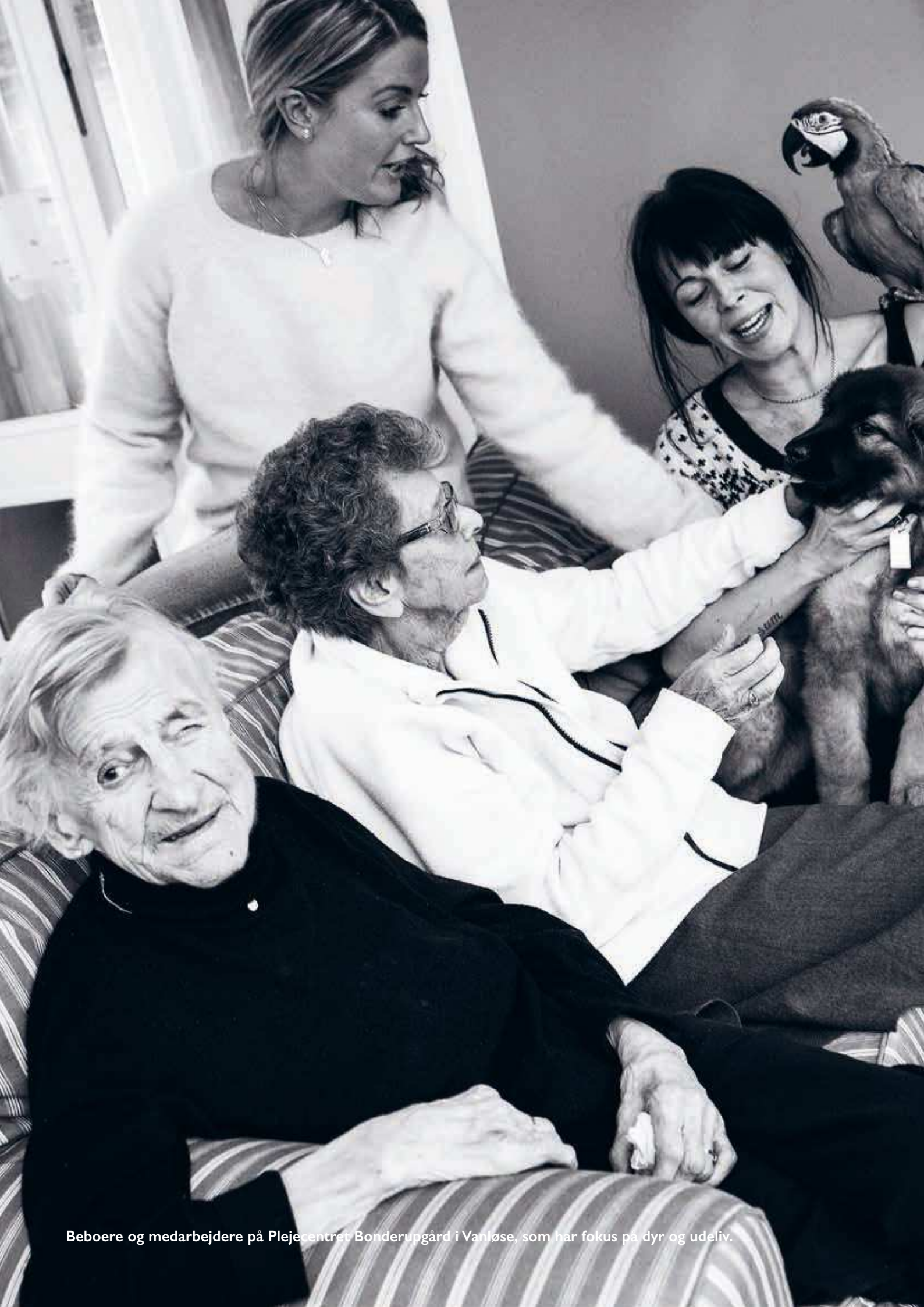
Beboere og medarbejdere på Plejecentret Bonderupgård i Vanløse, som har fokus på dyr og udeliv.