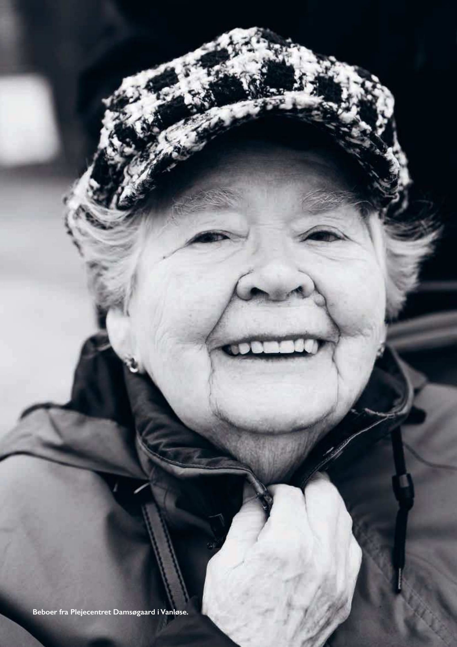
Beboer fra Plejecentret Damsøgaard i Vanløse.