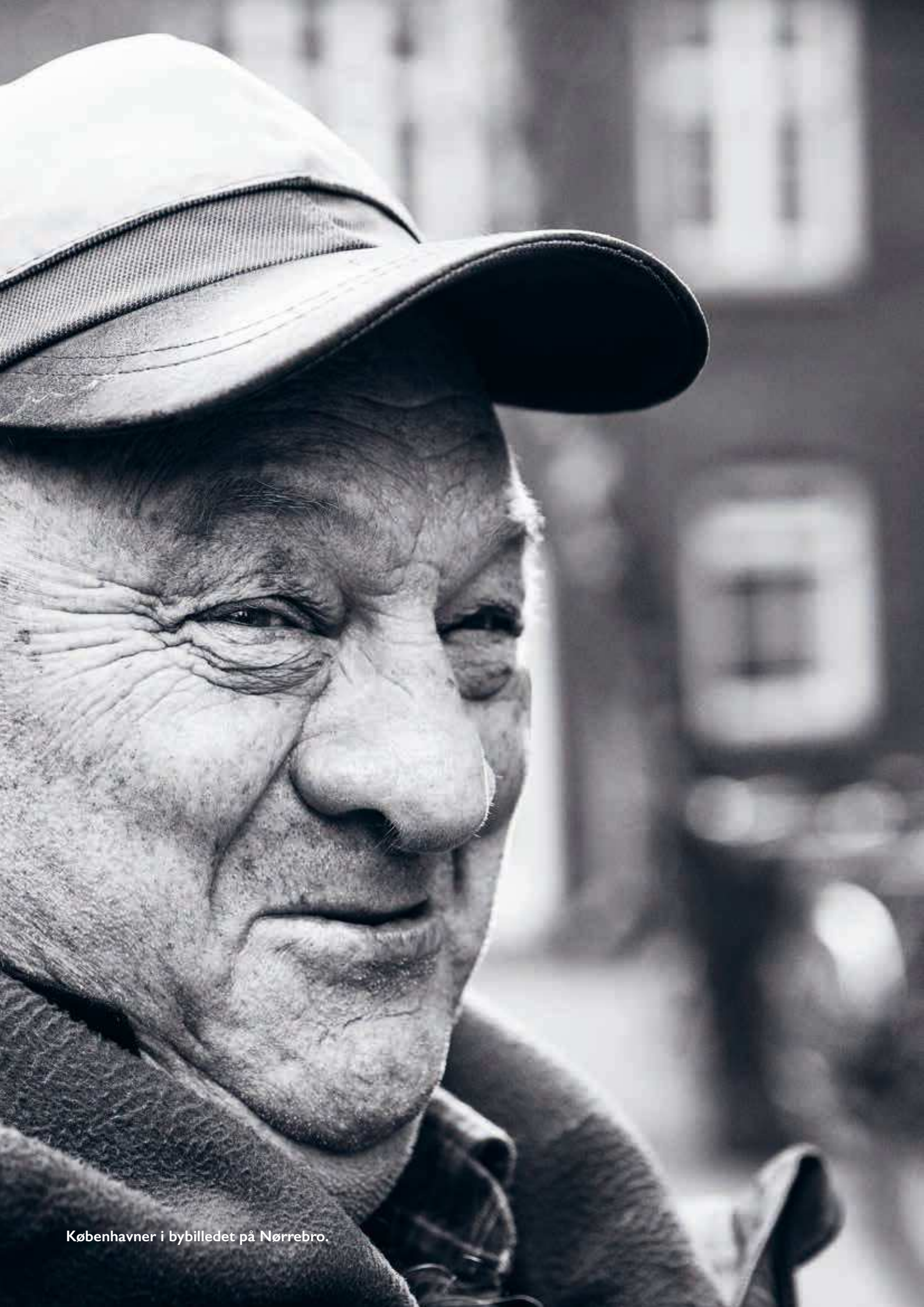
København i bybilledet på Nørrebro.