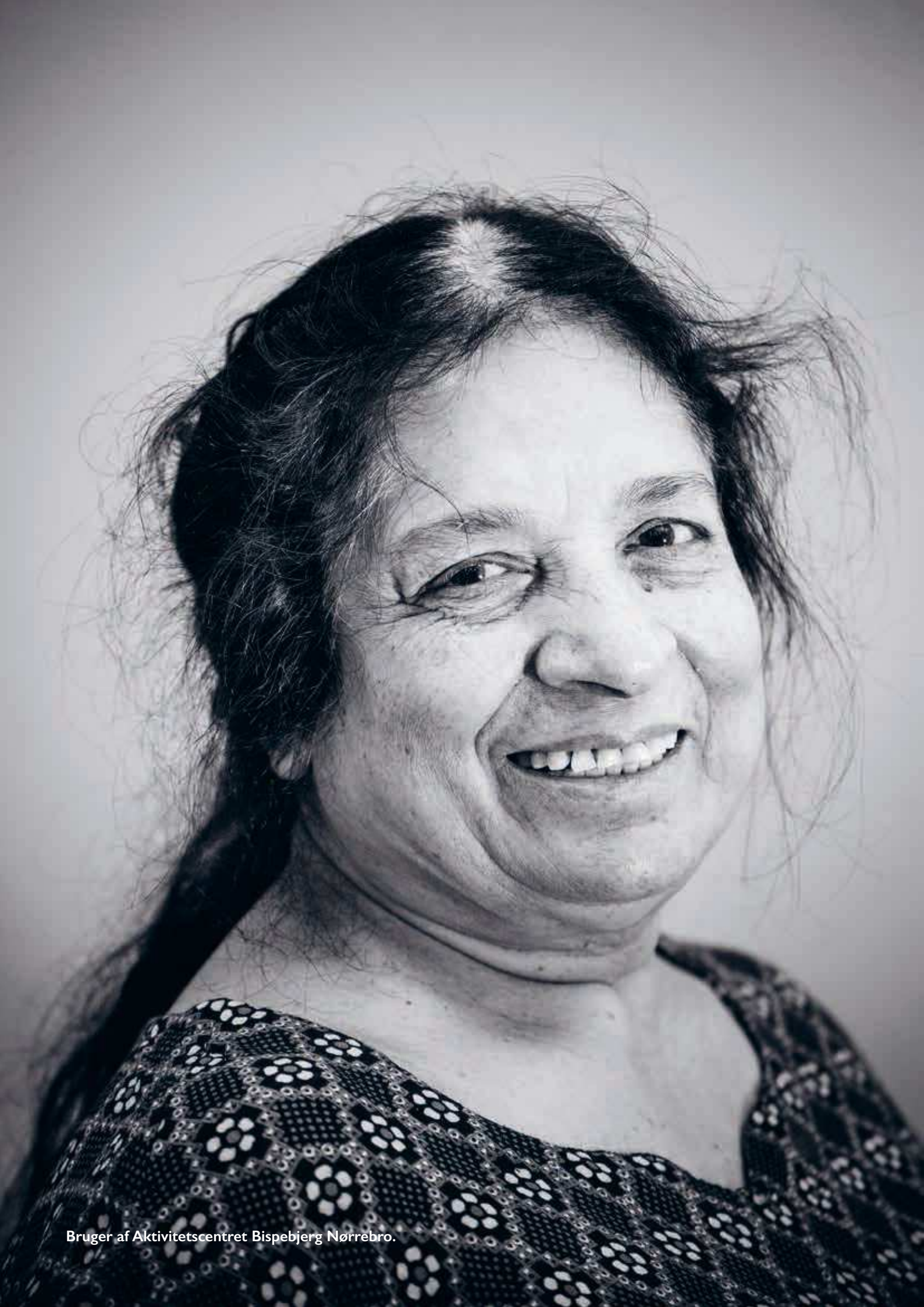
Bruger af Aktivitetscentret Bispebjerg Nørrebro.