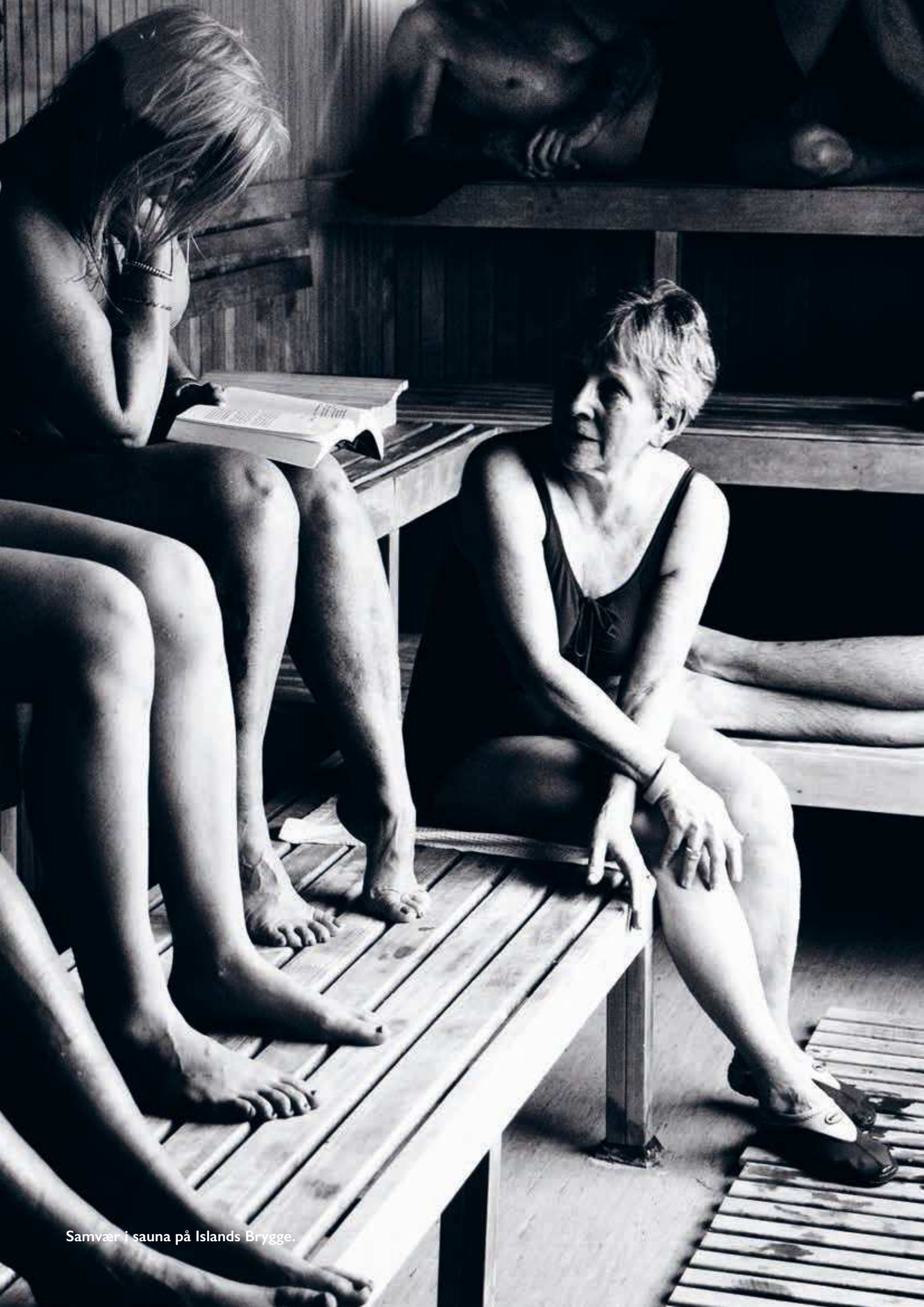
Samvær i sauna på Islands Brygge.