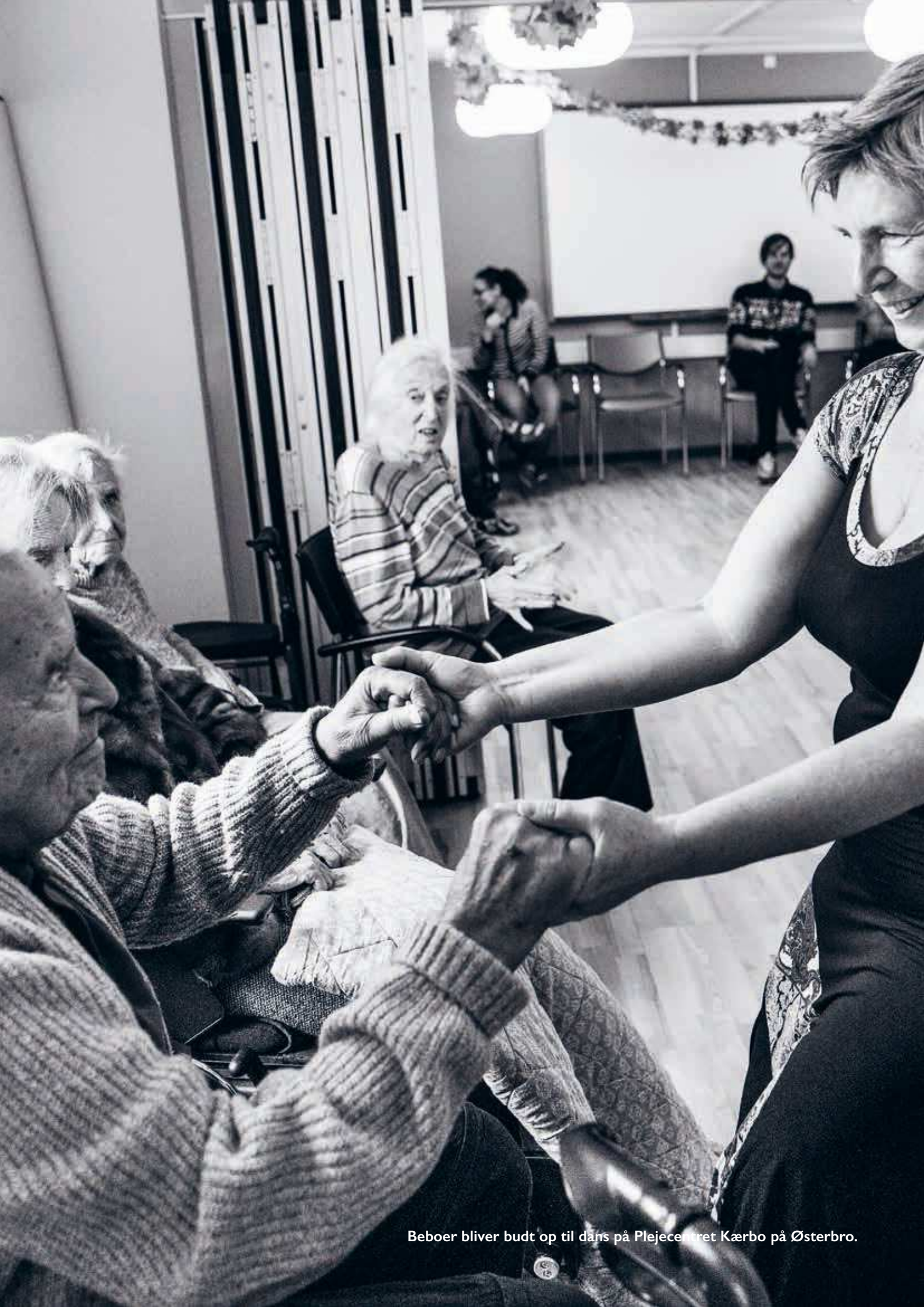
Beboer bliver budt op til dans på Plejecentret Kærbo på Østerbro.