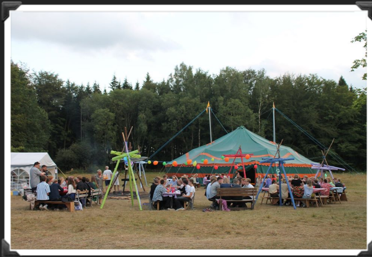
Billede fra Gawendas sommerlejr, hvor 120 børn og unger hvert år tager afsted i 10 dage.

Vi ønsker alene årlig støtte til husleje og administration. Se vedlagte budget eksempel.