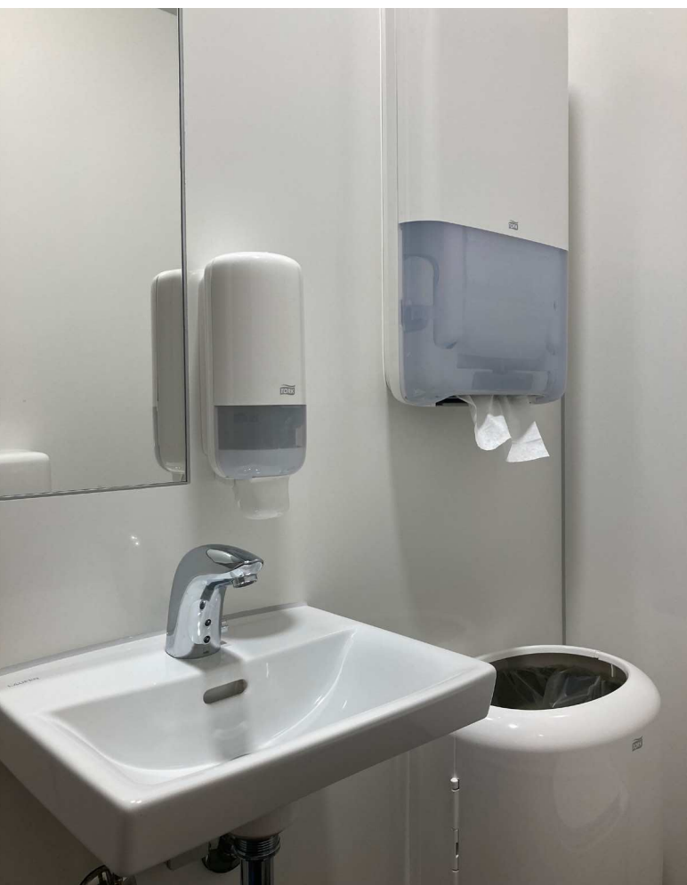
Spejl er smallere end håndvaskens bredde. På den måde sikres korrekt placering af sæbedispenser.

Toilettets inventar skal placeres hensigtsmæssigt med tanke på optimal adfærd og brug. Det gælder om at dryppe mindst muligt på gulvet efter at have vasket hænder, så oplevelsen af renhed sikres bedst muligt. Dertil skal inventar så vidt muligt væghænges, da det letter den daglige rengøring.