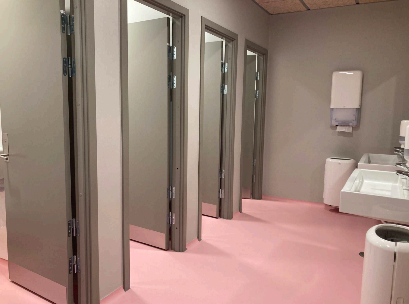
Sluseholmen Skole og Fritid