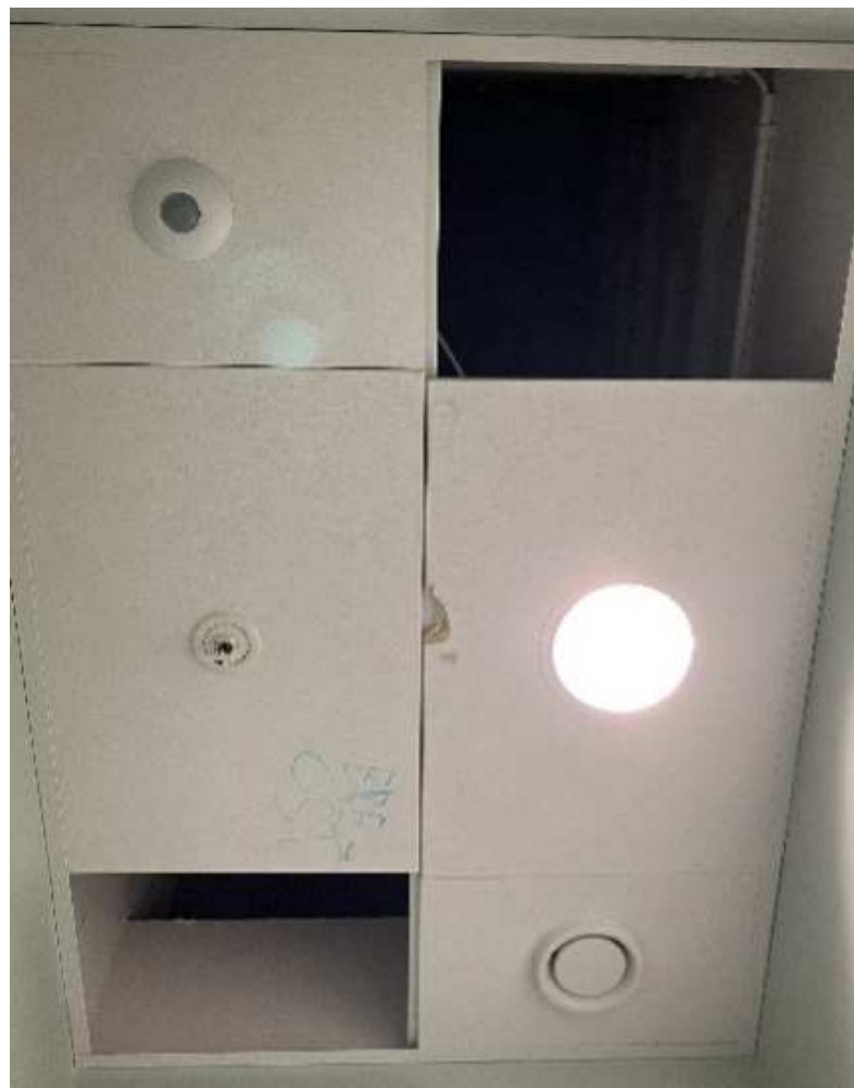
Skolen på Islands Brygge

Mange elever oplever utrygge forhold. Fritstående vægge (spanske vægge), dårlige låse og manglende indkig til forrummene skaber usikkerhed og er årsag til, at nogle elever undgår at bruge toiletterne. Toiletbesøg handler ikke kun om funktionelle behov, men også om at føle sig tryk og have ret til privatliv. Derfor er det vigtigt at tænke lydisolering, belysning og ventilation ind i toiletindretningen – så rummet føles trygt og privat.