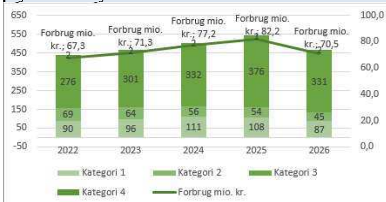
Figur 3. Udvikling i elever i BUF-flex tilbud i 2022-2026

Figur 3 og 4 viser udviklingen i antallet af elever i BUF-flex og skoleflex fra 2022 -2026.