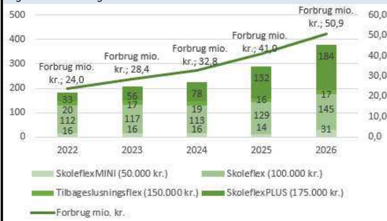
Figur 4. Udvikling i elever i skoleflex tilbud i 2022-2026

Figur 3 viser, at antallet af brugere af BUF-flex forventes at falde markant i 2026, men med det største fald indenfor elever i kategori 3 tilbuddene. Den modsatte tendens ses i tilbuddet skoleflex jf. figur 4. Figuren viser, at der er sket en væsentlig stigning i specielt SkoleflexPlus tilbuddet fra 2022 og til nu, som er det dyreste tilbud indenfor de fleksible ordninger.