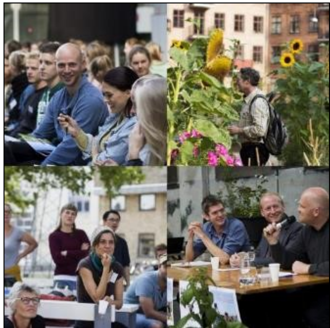
Eat Your City 2014

I samarbejde med de øvrige miljøpunkter og lokaludvalg i København planlægger Miljøpunkt Amager at arrangere en større konference med fokus på byhaver, sociale indsatser og grøn cirkulær økonomi. Formålet med konferencen er at sætte fokus på hvordan gode lokale løsninger kan skabe en grønnere by og hvordan der i spændingsfeltet mellem natur, sociale indsatser og cirkulær økonomi kan skabes blivende resultater indenfor grøn og bæredygtig byudvikling.