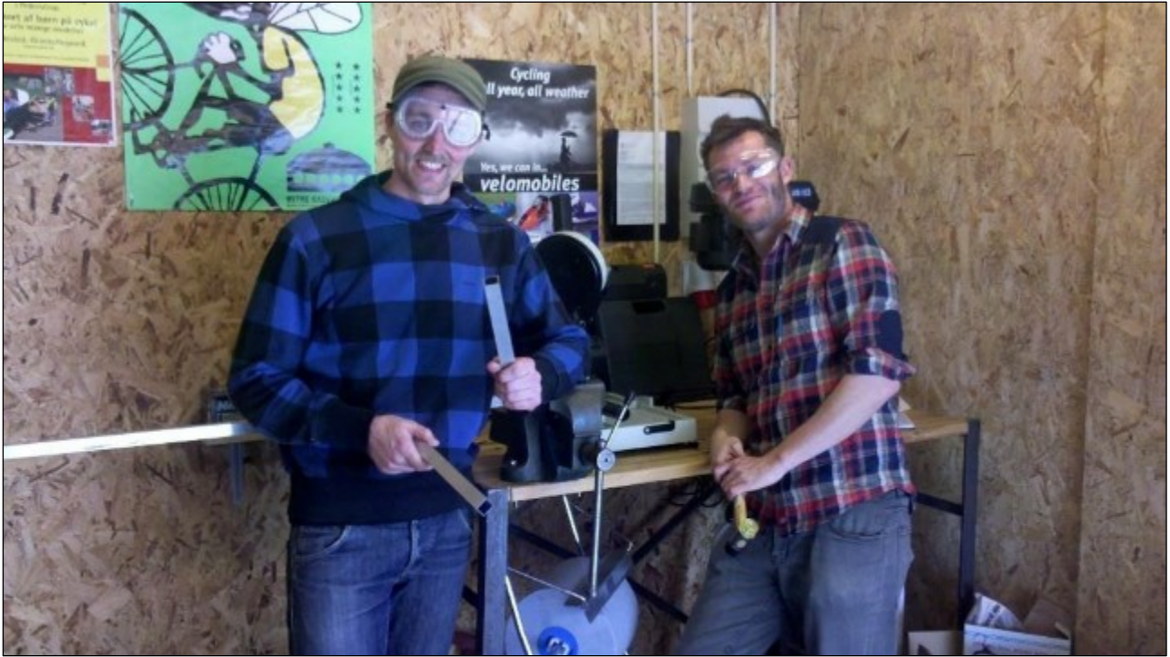
Workshop i Cykelbibliotekets værksted