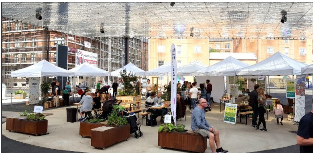
Lokal Mad på Musiktorvet 2017

Med projektområdet vil der også være fokus på den spiselige vilde natur på Amager. Der vil blive afholdt praktiske og netværksskabende aktiviteter hele året rundt. Således vil der i 2018 blive arrangeret ture til bl.a. Amager Fælled, Kalvebod Fælled, Kløvermarken, Amager Strand med fokus på Amagers vildtlevende spiselige planter og urter.