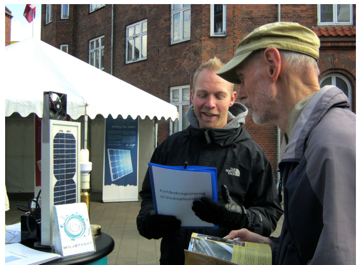
Claus fortæller om de nye vindmølleandele.

I bydelsplanen for Amager Øst er planerne indarbejdet som et selvstændigt projekt.