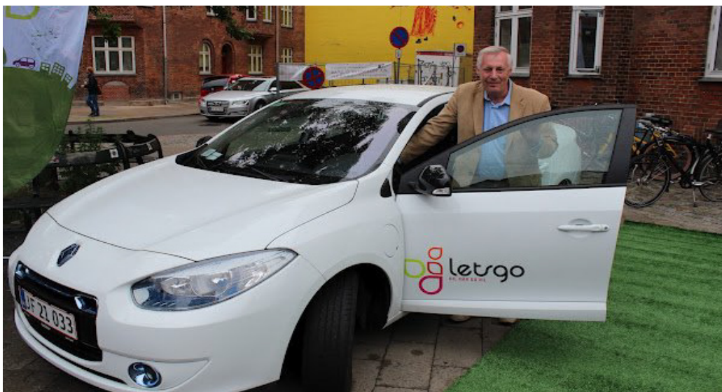
Transportminister Henrik Dam prøver en el-bil fra delebilsordningen.

Målsætningerne for indsatsområder er kun delvist opfyldt. Der har i løbet af 2012 været afholdt og igangsat væsentlige initiativer, men vi må også ser i øjnene, at indsatsen kunne have haft større gennemslagskraft. Vi håber, at aftalerne med foreningen LetsGo i 2013 vil kunne give anledning til konkrete deleordninger i samarbejde med lokale boligforeninger.