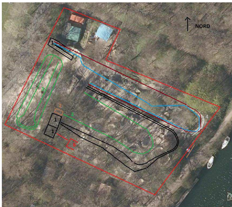
Figur 2. Luftfoto med cykelbanen og tilhørende anlæg (fra ansøgningsmateriale).

Der er i alt syv forskellige cykelbaner, som er kategoriseret i grøn, blå, rød og sort alt efter sværhedsgrad.