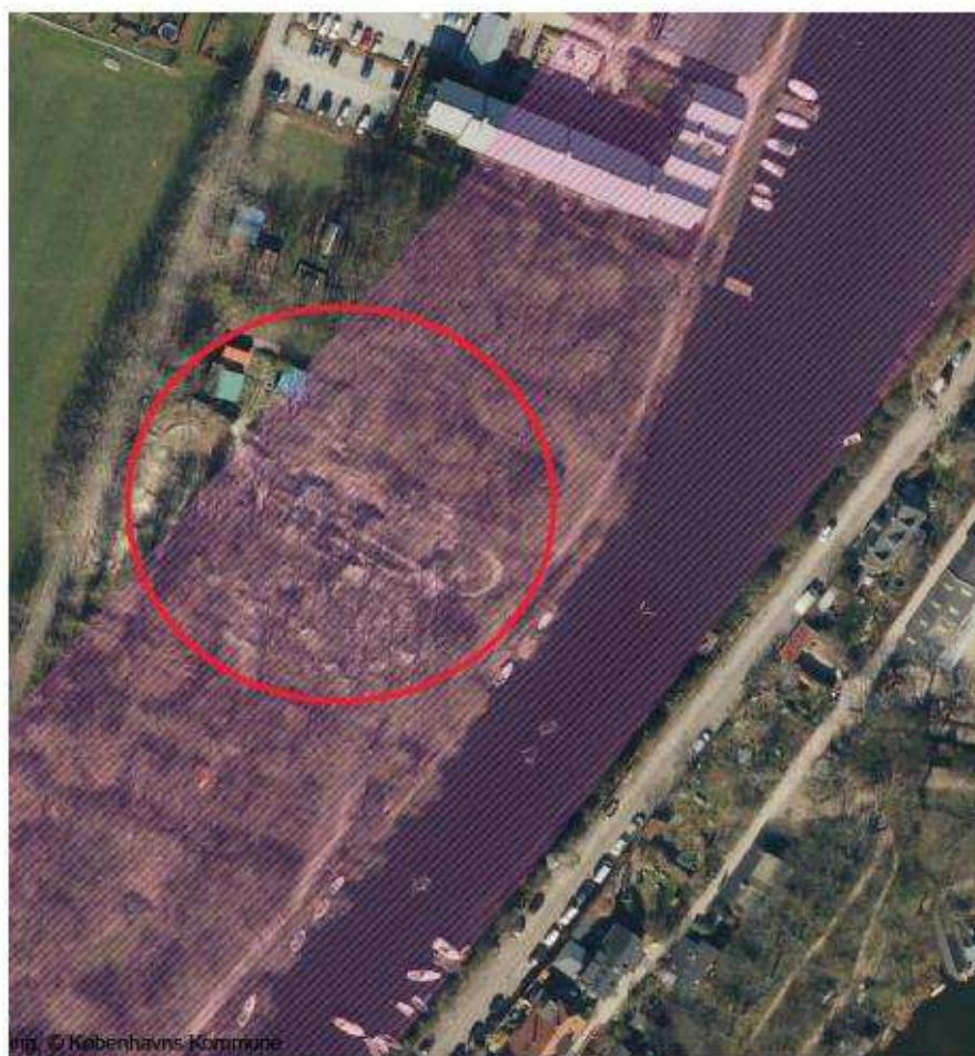
Fig. 1. Luftfoto med markering af fortidsmindebeskyttelseslinjen og cykelbanen med tilhørende anlæg ved Laboratoriegraven. Dele af Christianshavns Vold med Christiania ses mod øst (højre i billedet).