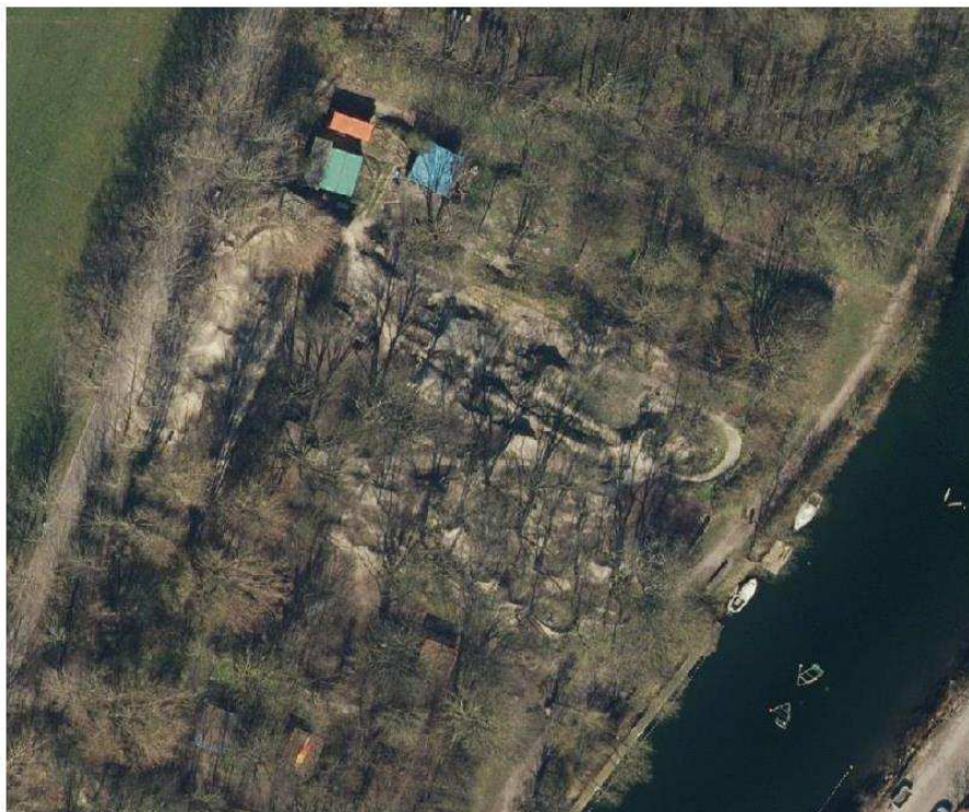
Luftfoto fra 2020

Etablering af hop ved påkørsel af 300-400 t jord samt graveaktiviteter i de historiske krudtvolve har medført, at voldanlæggets udenværk i dag har mistet sin oprindelige karakter. Det er forvaltningens vurdering, at der er foretaget så væsentlige indgreb i det oprindelige landskab, at ændringerne påvirker fortidsmindets fremtræden som voldanlæg og dermed forstyrrer oplevelsen af fortidsmindet som et landskabslement.