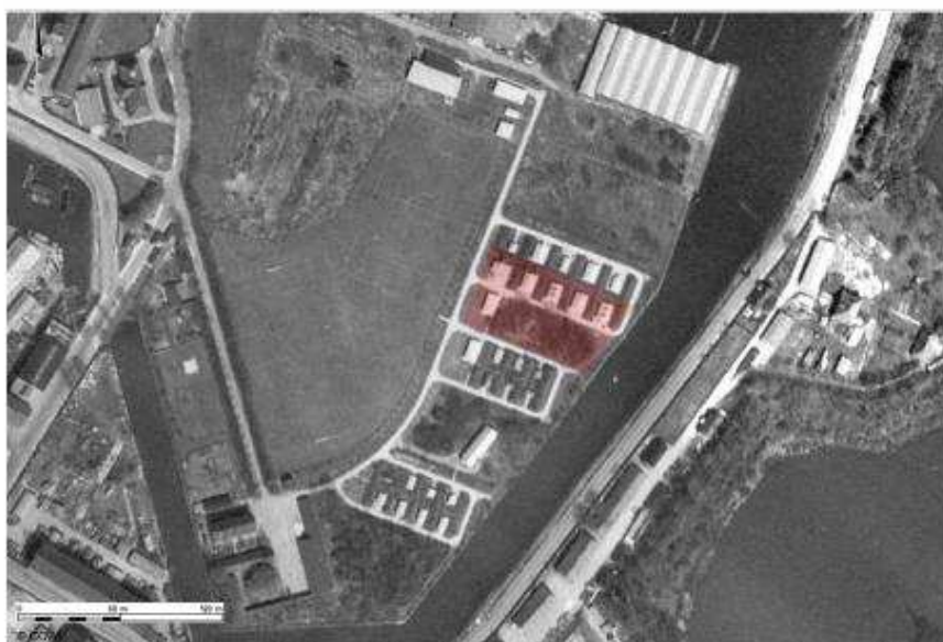
Fig. 4. Luftfoto fra 1954 med krudtvoldene. Cykelbanen er placeret i den nordlige del (rød markering).