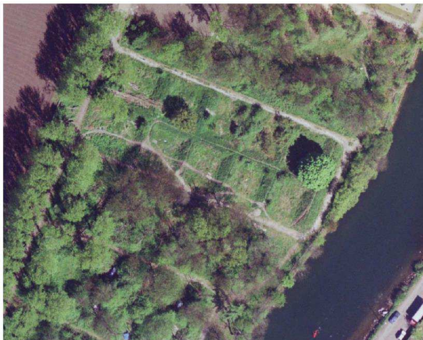
Luftfoto fra 2001

Kommunens luftfotos fra 2001 og 2020 viser tydeligt de store forandringer, området har gennemgået siden etablering af cykelbanen. Ændringerne omfatter stort set hele arealet inden for beskyttelseslinjens udstrækning mellem vejen Halvtolv og Laboratoriegraven og medfører, at det oprindelige terræn i dag er stort set ugenkendeligt.