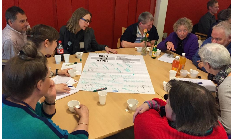
I grupper diskuterede deltagerne muligheder for fællesskaber og fælles møderum på tværs af de tre brugergrupper: børn, unge og plejecentrets beboere.