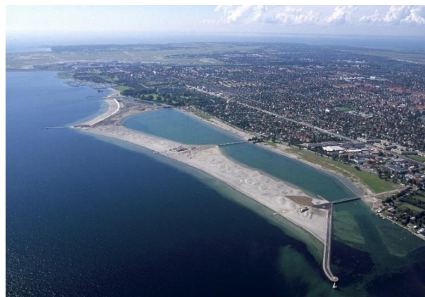
Området ud for Amager Strandpark.