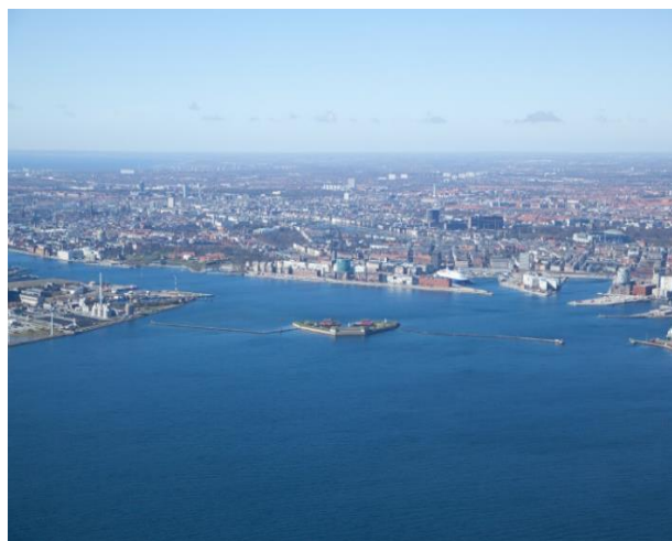
Området ud for Trekroner.