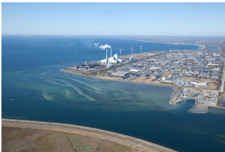
Området ud for Avedøre Holme.