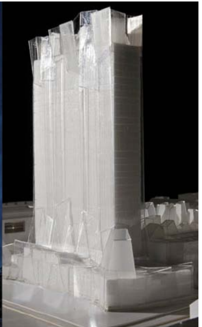
Kim Utzon arkitekter