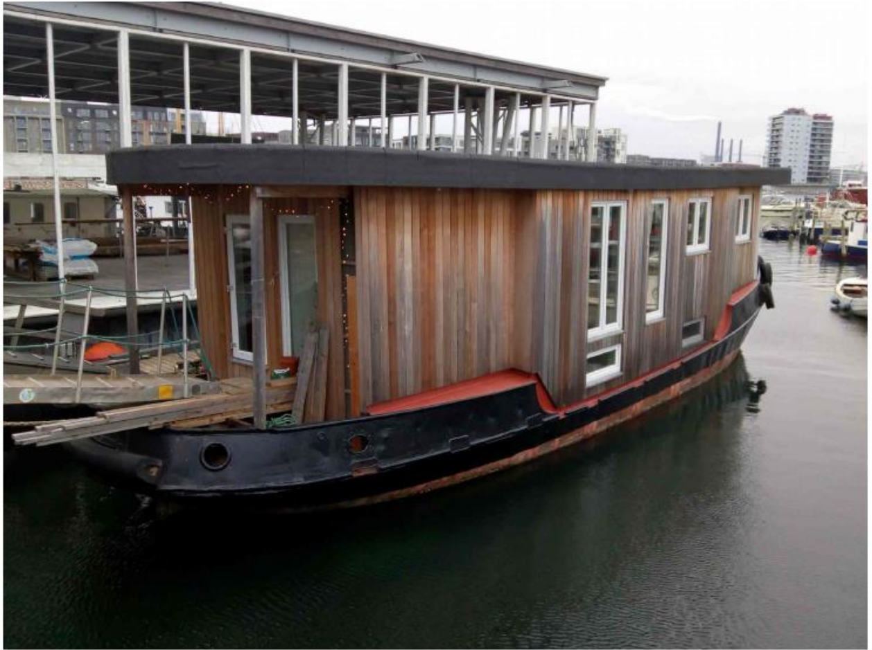
Foto af husbåden Mads/Haalin, der ønskes placeret ved Skibbroen.