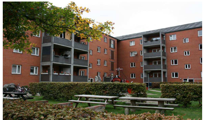
Bebyggelsen set fra gårdsiden.