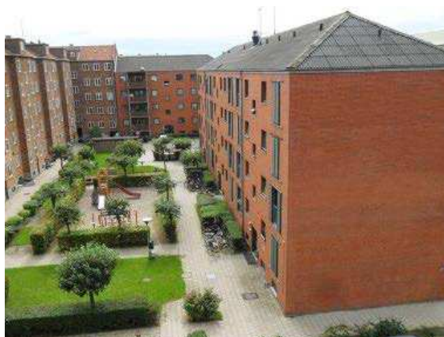
Bebyggelsen set fra gårdsiden