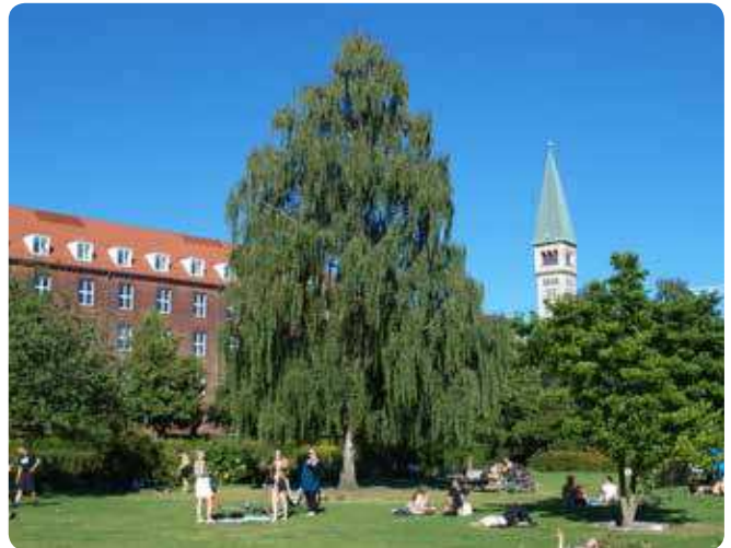
I byens parker er der plads til, at de store flotte solitære træer kan 'folde sig ud'. Parktræerne er med til at danne rammer for parkens rekreative funktioner, som det ses her i Enghaveparken.