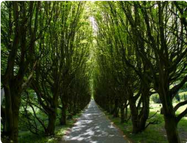
Træer er med til at skabe kulturhistorisk værdi og giver samtidig også naturoplevelser, som her på Vestre Kirkegård.