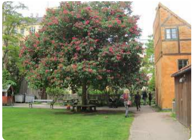
I mange af Københavns fælles gårdhaver gror der store træer, der giver gårdrummene en hel særlig karakter og identitet, som det ses her i en gårdhave på Christianshavn.