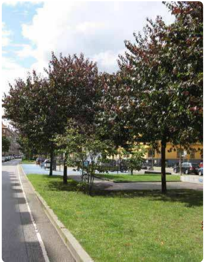
I forbindelse med renoveringen af Sønder Boulevard blev der plads til/bevaret træer, som er med til at skabe læ og skygge. Træerne er med til at skabe et trygt rum til ophold væk fra vejen