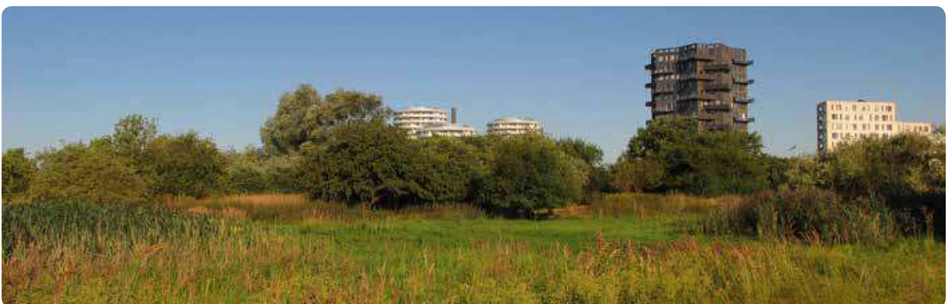
Træer i naturområder er ofte hjemmehørende arter. De er derfor vigtige bidragsydere i forhold til at øge den biologiske mangfoldighed, da de hjemmehørende arter er hjemsted for mange insekter og svampe.