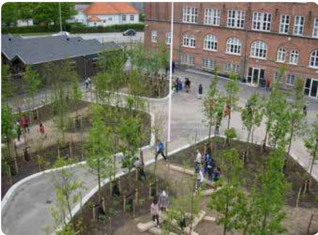
Amager Fælled Skole har fået landets første skovskolegård. Træerne er med til at danne ramme om spændende leg- og læringsmiljøer.