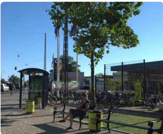
Træ der indgår i sammenhæng med de andre funktioner i byens rum.