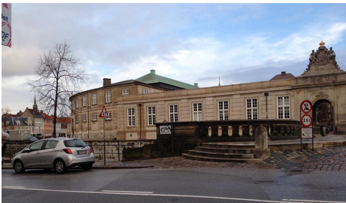
Billede 6 og 7, Marmorbroens sydvestlige brofæste, hvor det nærmeste træ er trukket længere væk fra brofæstet.