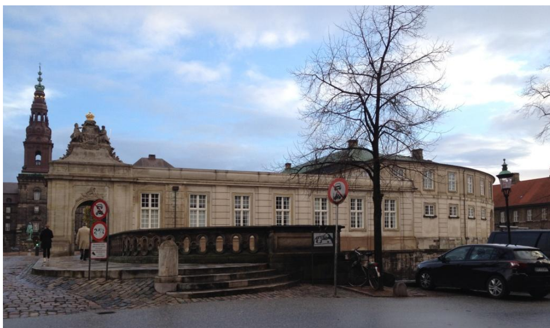
Billede 4 og 5, Marmorbroens sydøstlige brofæste