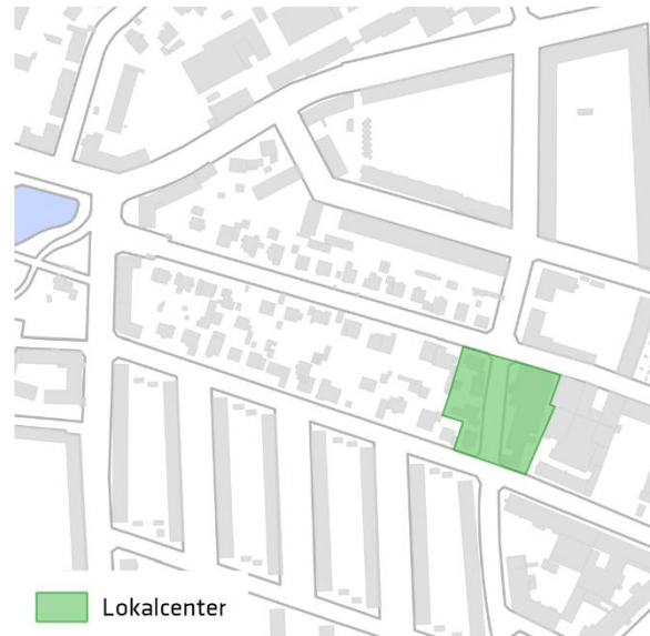
Kort 2: Foreslået ændring på baggrund af den offentlige høring