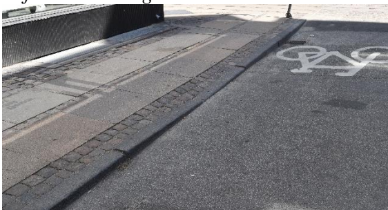
Olfert Fischers gade:

Mellem 10 og 25 % af fortovsarealet er beskadiget. Acceptabel komfort for fodgængere, men ikke for rollatorbrugere, kørestole eller barnevogne. Fortovet fremstår ikke æstetisk pænt - det kan holde 5-6 år uden større renoveringsarbejder. Typiske skader: Knækkede fliser, afskalninger i betonfliser, løse chaussesten i ledelinie og lunger i for- og bagkanter. Der kan mangle en ledelinie, så fortovet ikke lever op til gældende krav til tilgængelighed.