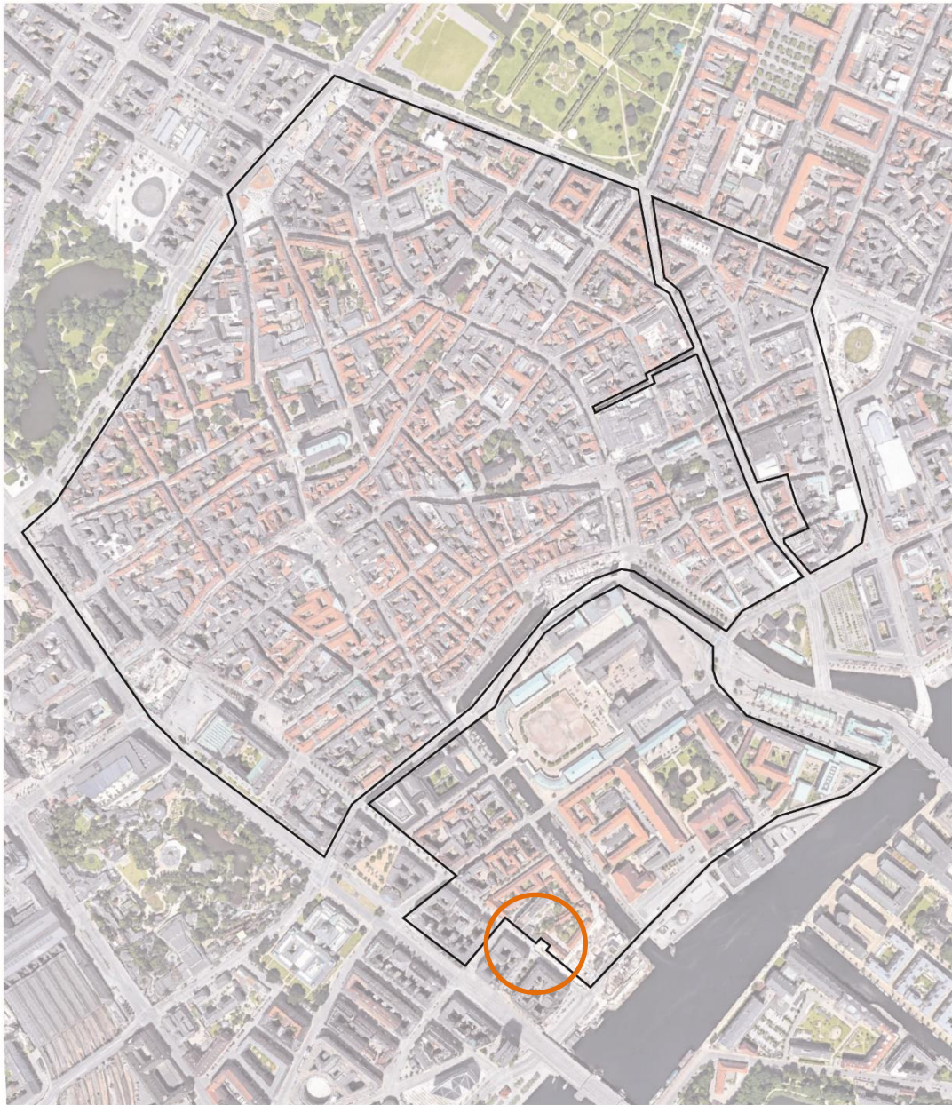
Kort 2. Supplerende kort til dialogproces for mindre biltrafik i middelalderbyen, der præciserer adgang til Blox parkeringsanlæg med indkørsel fra Vester Voldgade (overfor Christiansborggade).