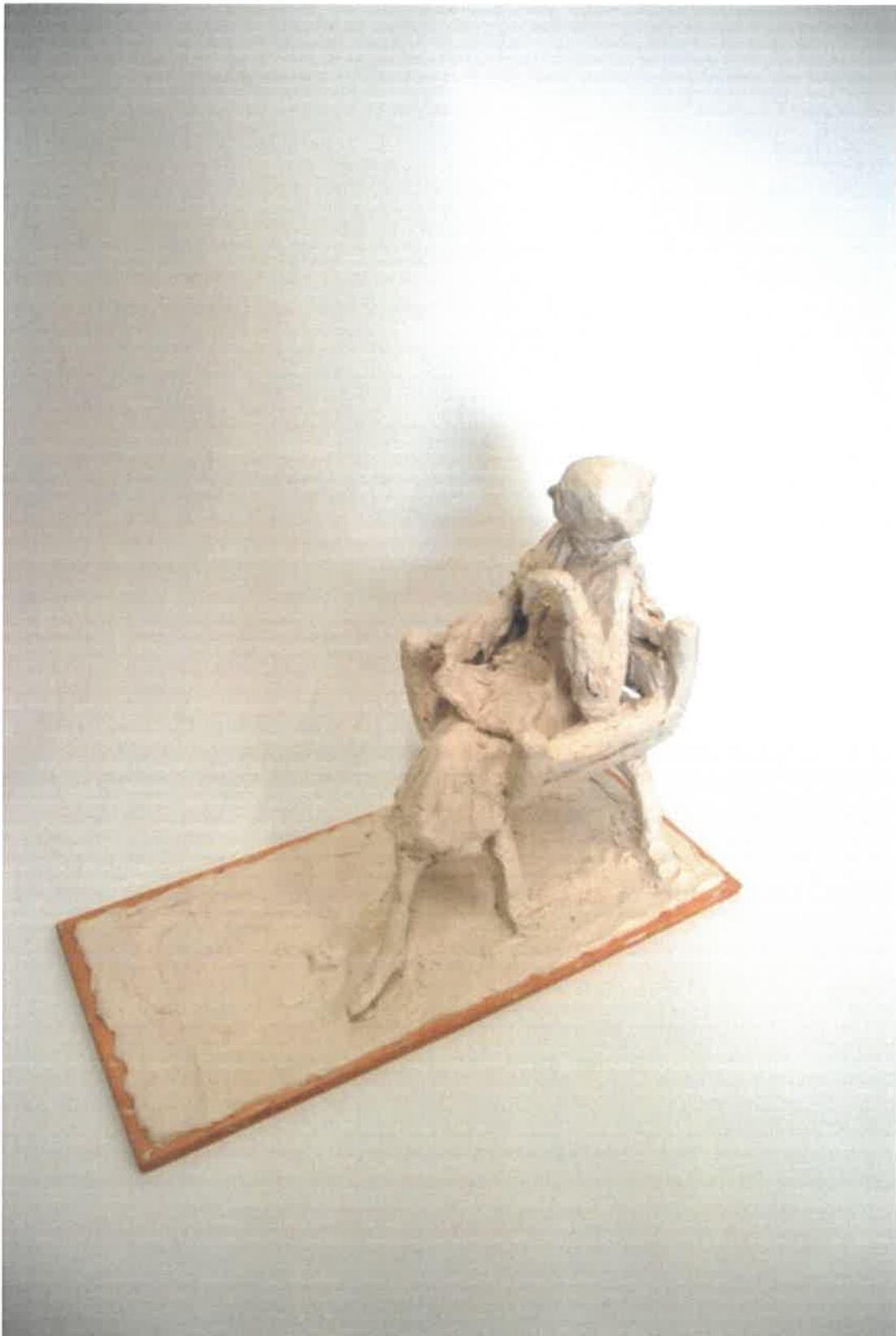
Fotograf Rikke Raben / Skitese Faccolina voks, Rikke Raben 2017