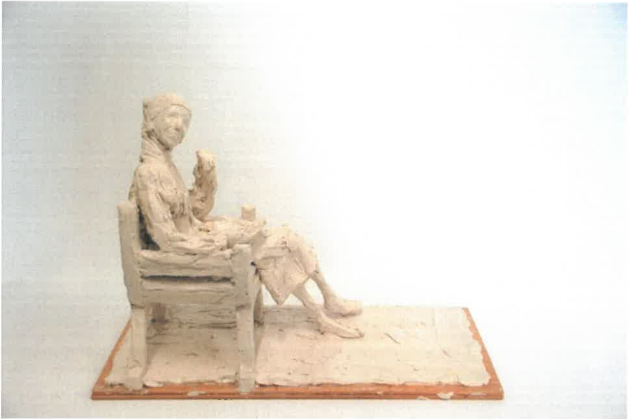
Skitese Faccolina voks, Rikke Raben 2017