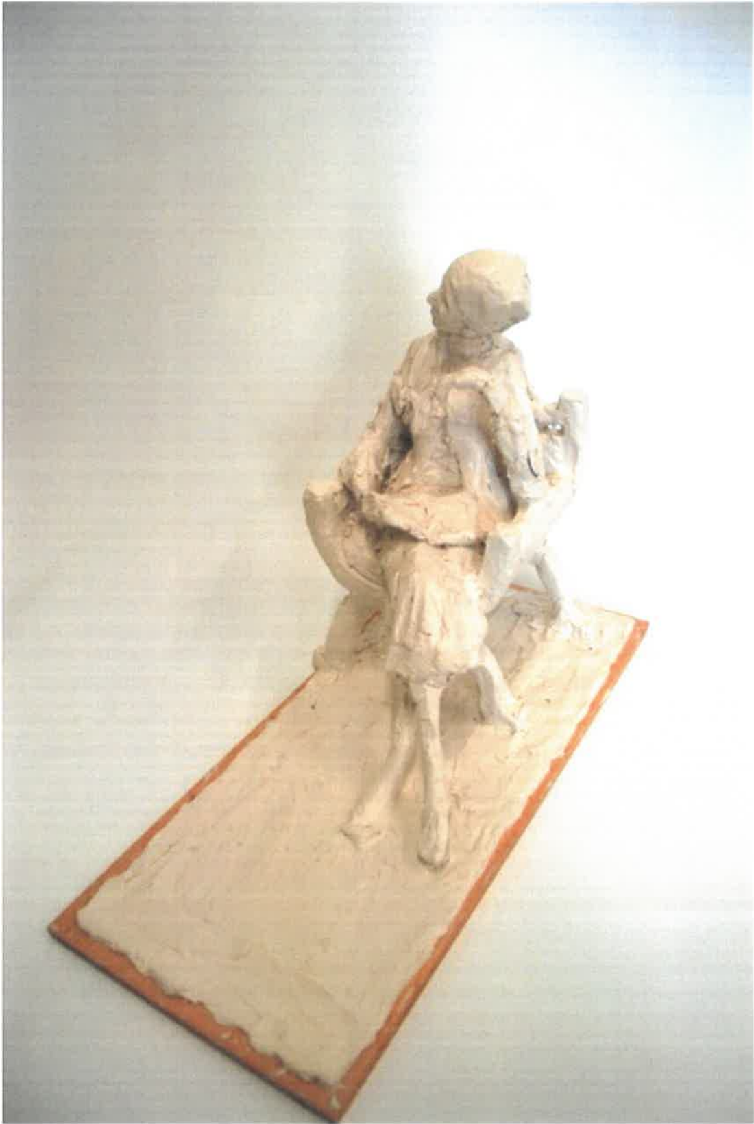
Skitese Faccolina voks, Rikke Raben 2017