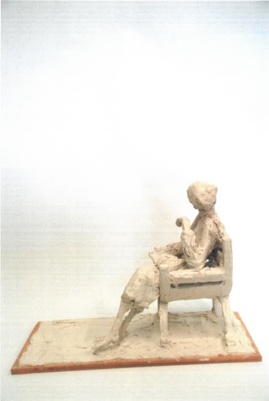
Skitese Faccolina voks, Rikke Raben 2017