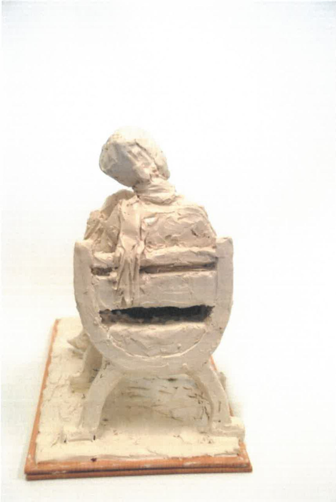
Fotograf Rikke Raben / Skitese Faccolina voks, Rikke Raben 2017