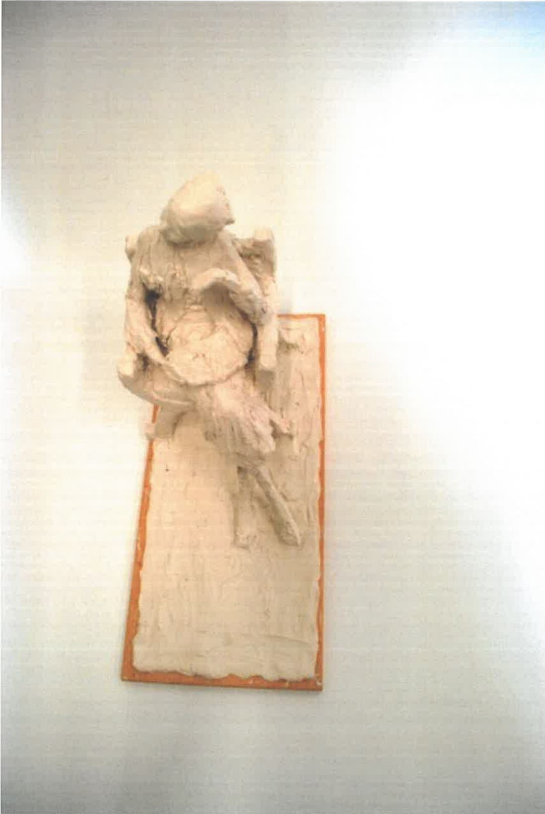
Skitese Faccolina voks, Rikke Raben 2017