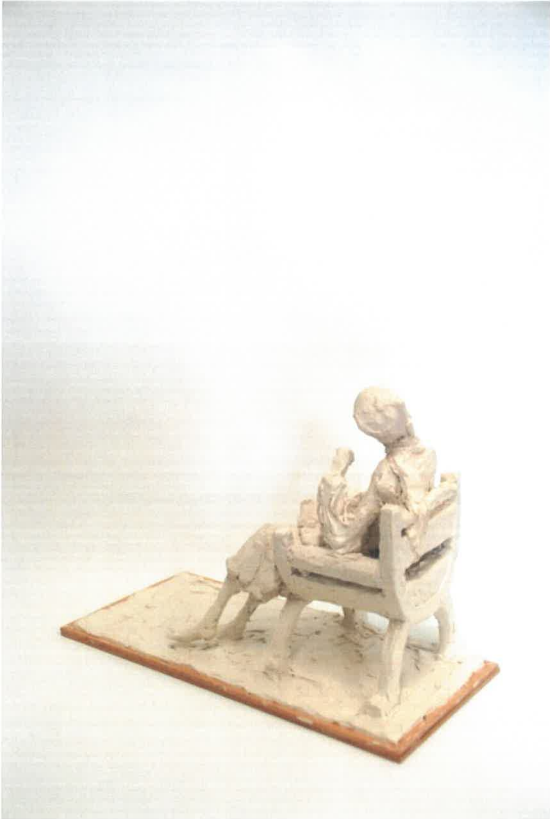
Fotograf Rikke Raben / Skitese Faccolina voks, Rikke Raben 2017