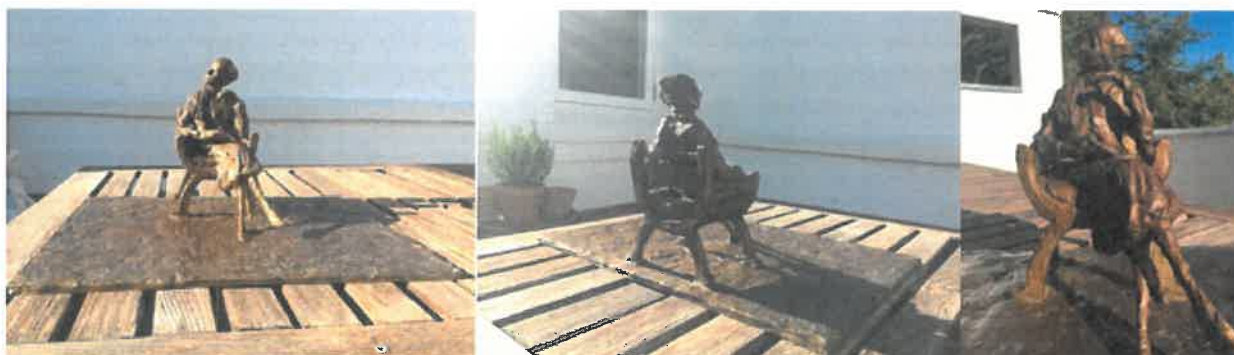
Støbt i bronze forlægget til fuldfigursportræt i model størrelse af Karen Blixen, udført af billedhugger Rikke Raben færdiggjort i juni 2018.

Med udgangspunkt i vores hovedstad og traditionen med at opstille portrætter af markante danskere i det offentlige rum, vil det være naturligt at en af vores mest berømmede forfattere Karen Blixen, får en statue i København, så også hun kan symbolisere vores kunnen og vores værdier.