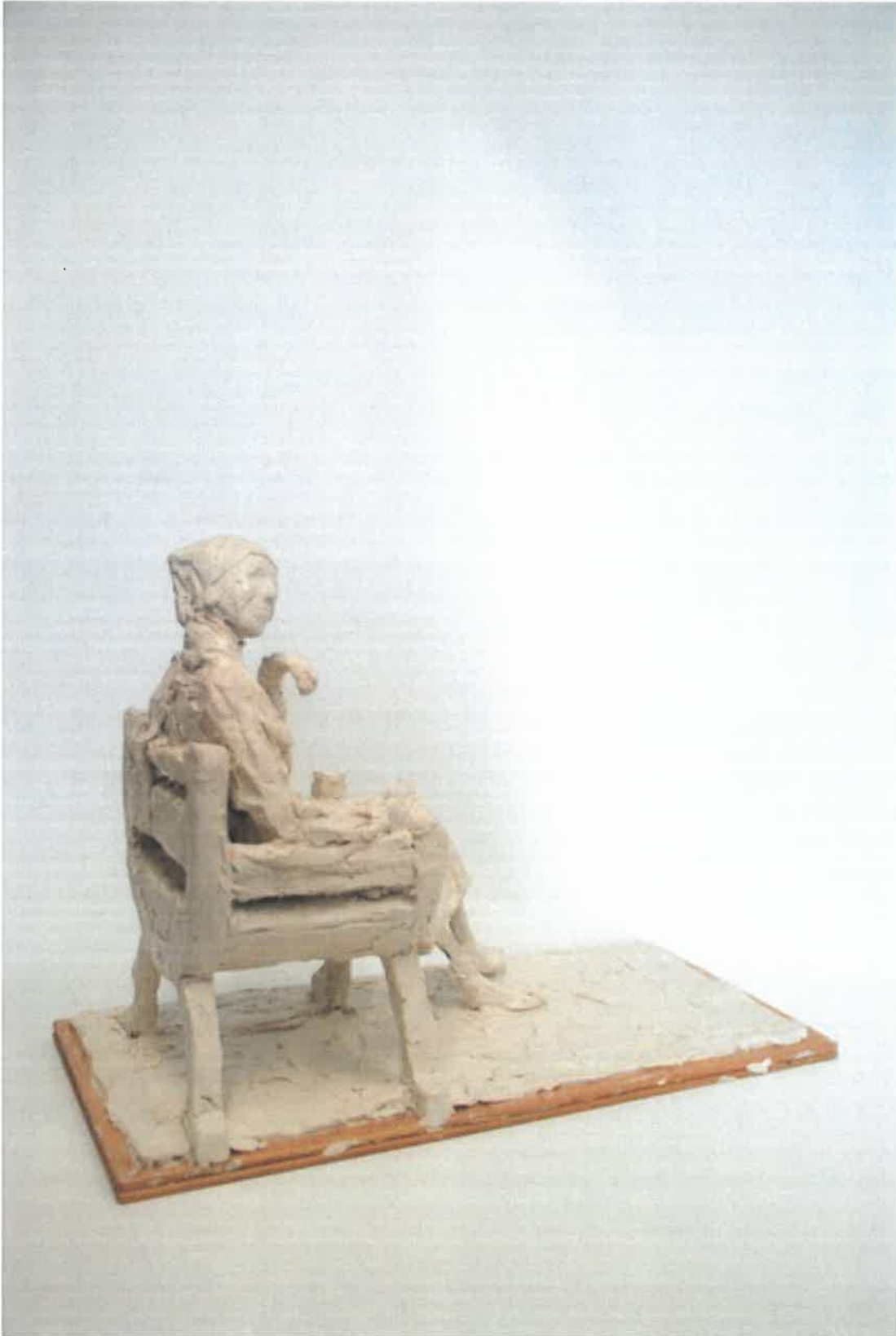
Skitese Faccolina voks, Rikke Raben 2017