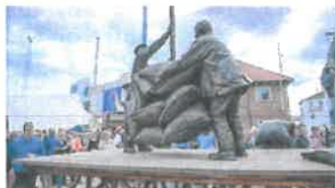
Galschiøts havnearbejderskulptur, opsat på Århus Havn august 2017

Vi har valgt Jens Galschiøt, fordi hans øvrige skulpturer udtrykker meget af det, vi gerne vil have frem; ses i hans skulptur opsat på Århus Havn i august 2017 (se billede).