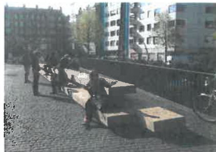
Bænken hvor skulpturen tænkes placeret i baggrunden. Her kan mennesker sidde i selskab med skulpturen og dens historie