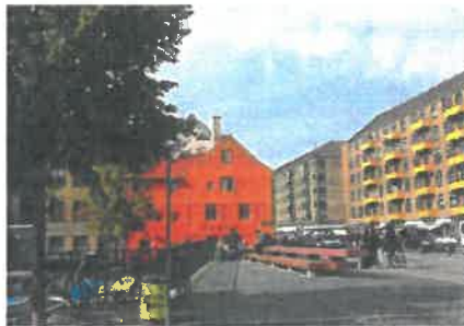
Børnehusbroen set fra Ovengaden Oven Vandet Skulpturen tænkes opstillet ved rækværket bag papirkurven