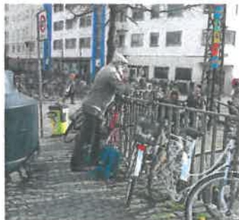
Illustration af skulpturens placering og stilling