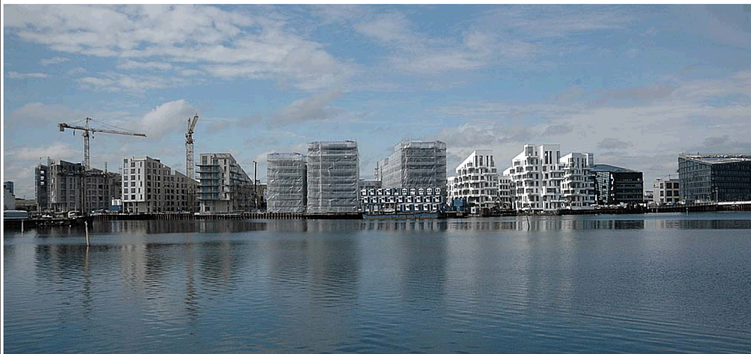
Billeder fra sommeren 2007