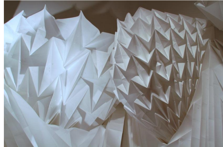
Barbara Cooper's Folded Terrains

Scenografisk suppleres Barbara Cooper's Folded Terrains overalt i udstillingen af landskaber af levende planter og træer, ligesom der vil være adgang mellem udstillingen og haveanlægget.