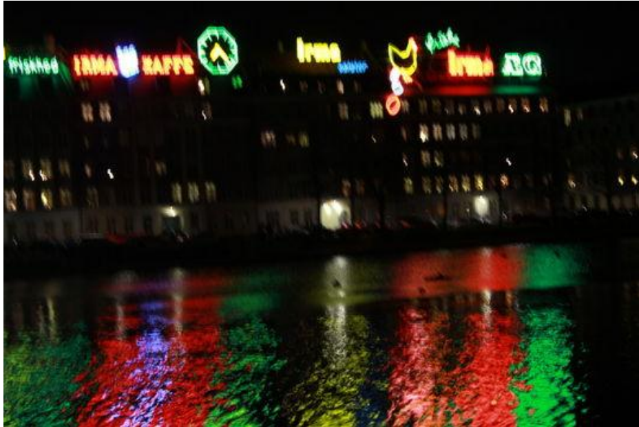
Urban Nature, uploaded af rainbow, Københavns Museum VÆGGEN

Alle de fem projekter under temaet Byens natur vil være ledsaget af en levende programvirksomhed, i museet og på relevante steder i byrummet.