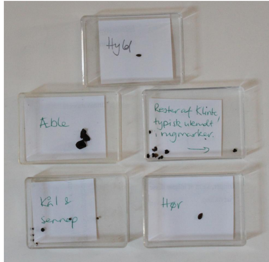
Makrofossiler fra latrin, Kulturvet. Udstillingen Fortiden under os , Københavns Museum

Der suppleres med yderligere materiale omkring dyrkning, afgrøder, om ernæringstilstande, sygdomme, og om fødekredsløbene i og mellem indre by og omkringliggende jorder i forskellige historiske perioder.