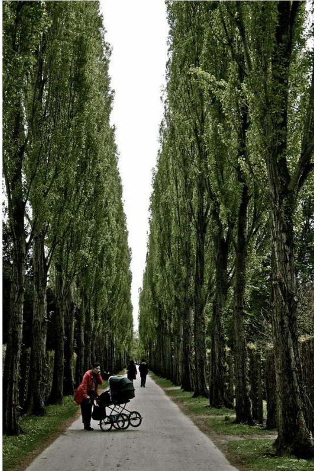
Going to see the Wizard, uploaded af Rikke, til Københavns Museum VÆGGEN