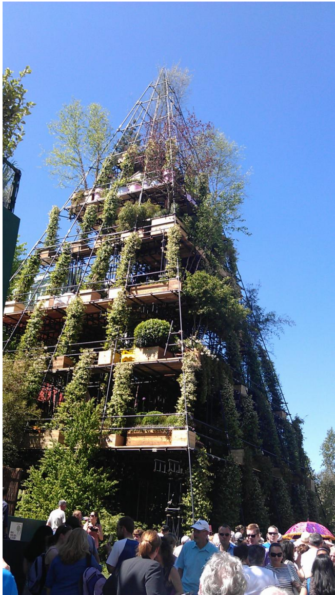
Diarmud Gavin's Westland Magical Tower, Chelsea Garden Show, 2012