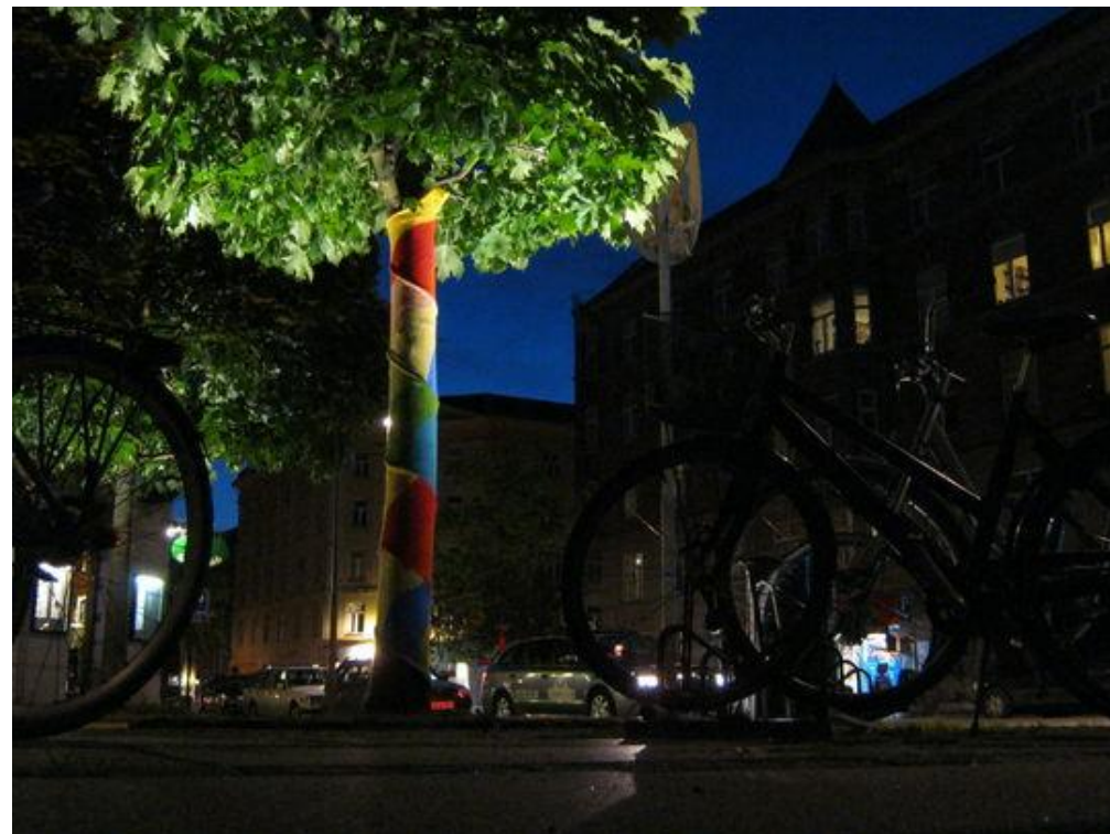
Urban Nature

En udfordring i den kommende periode bliver at forankre en bæredygtighedsdagsorden hos den enkelte borger eller grupper af borgere i deres frivillige, selvvalgte fritidsaktiviteter, således at københavnere kan se sig selv som en aktiv del af løsningerne.