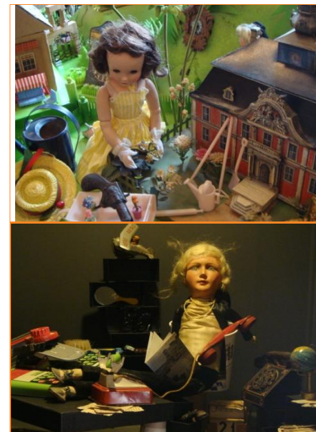
Udstillingen Storbyspillopper , Københavns Museum