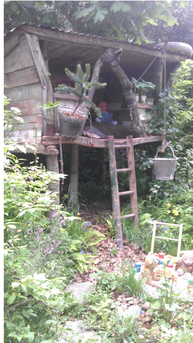
What will we leave? The NSPCC Garden of Magical Childhood. Chelsea Garden Show, 2013

'Haven', som ide, som virkeligt såvel som metaforisk sted, er også det sted, hvor 'natur og kultur kan smelte sammen på en måde, som er til gavn for begge parter. Mer end nogensinde før har vi brug for at lære at bruge naturen uden at ødelægge den. Og det kan formentlig ikke ske så længe vi fortsætter med at tænke på natur og kultur som hinandens modsætning'.