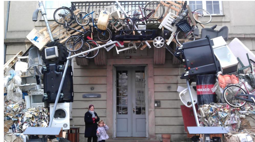
Udstillingen Skrald , Københavns Museum

Udstillingen vil i sit formsprog og interaktive væsen være rettet mod børn, men med rigeligt informationsmateriale til at være relevant for voksne også.