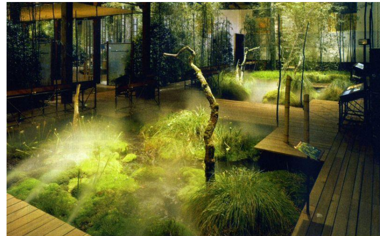
Gilles Clement, Le Jardin Planetaire, 1999-2000

Et særligt fremhævet spor i udstillingen kan showcase de – offentlige - projekter, metoder og resultater, som har været baggrunden for, at København er blevet udpeget som Green Capital.