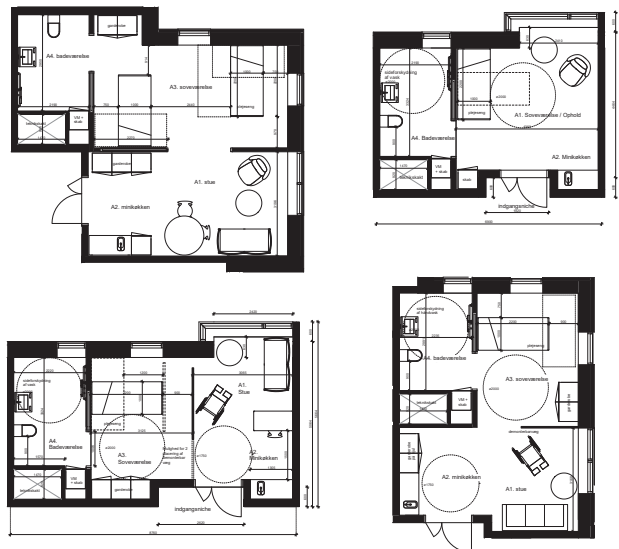
Udvalg af plantegninger der viser projektets plejeboliger. 68 x torums boliger. 17 boliger pr. boligetage. 12 x etrumms boliger. 3 boliger pr. boligetage.

Boligetagerne er organiseret i 2 adskilte boliggrupper med egen adgang, elevator og trappe til de fælles opholdsarealer og personalefaciliteter. Ved opsætning af skillevægge efter behov kan der etableres en fysisk adskillelse. Hertil kan der ved konvertering af 1 bolig etableres 2 selvstændige afdelinger, med egne personale- og opholdsfaciliteter.