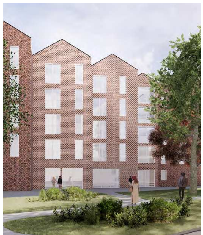
Visualisering der viser plejhjemmets facade mod nord.