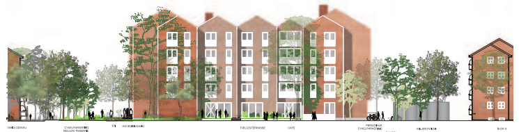
Facade mod nord.

Der etableres 14 parkeringspladser, hvoraf 3 pladser er beregnet for handicappede- og turbus. Der etableres 46 cykelparkeringspladser, hvoraf 24 er overdækkede. Hertil etableres der 5 overdækkede cykelparkeringspladser for særligt pladskrævende cykler i forbindelse med el-scooter garagen.