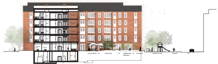
Snit gennem gården og gårdfacade mod vest.