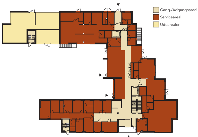
Funktionsdiagram for stueetagen.