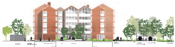
Facade mod syd.