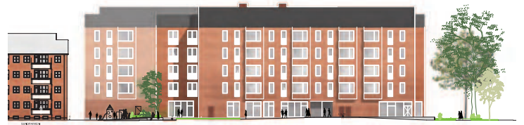
Facade mod øst.