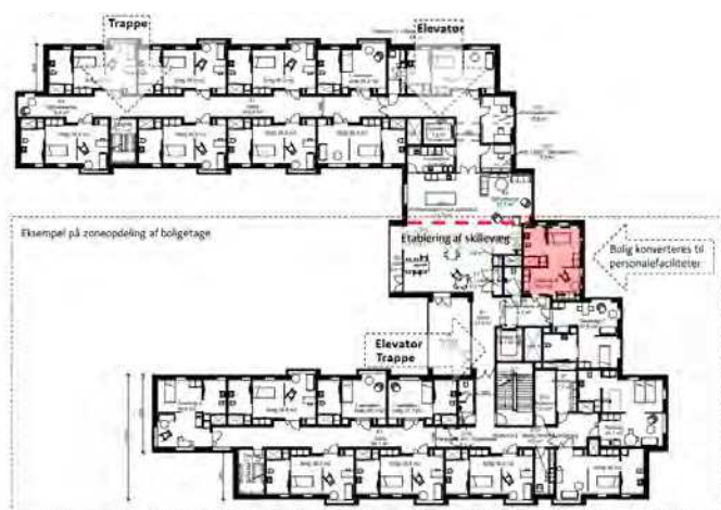
Etageplan af boligetagerne (1.- 4.sal) der viser mulighederne for at etablere pandemisikring ved behov.