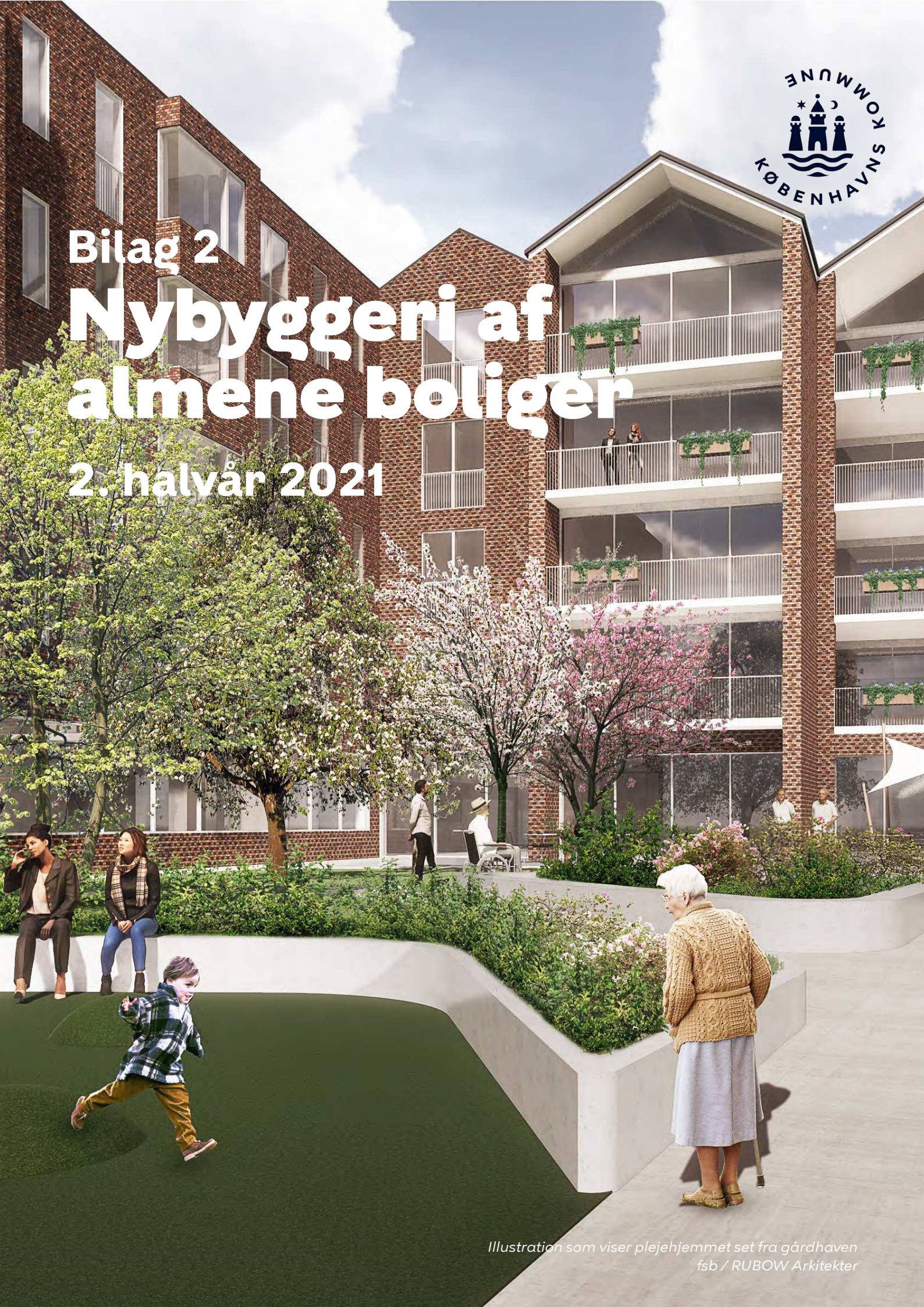
Illustration som viser plejehjemmet set fra gårdhaven fsb / RUBOW Arkitekter