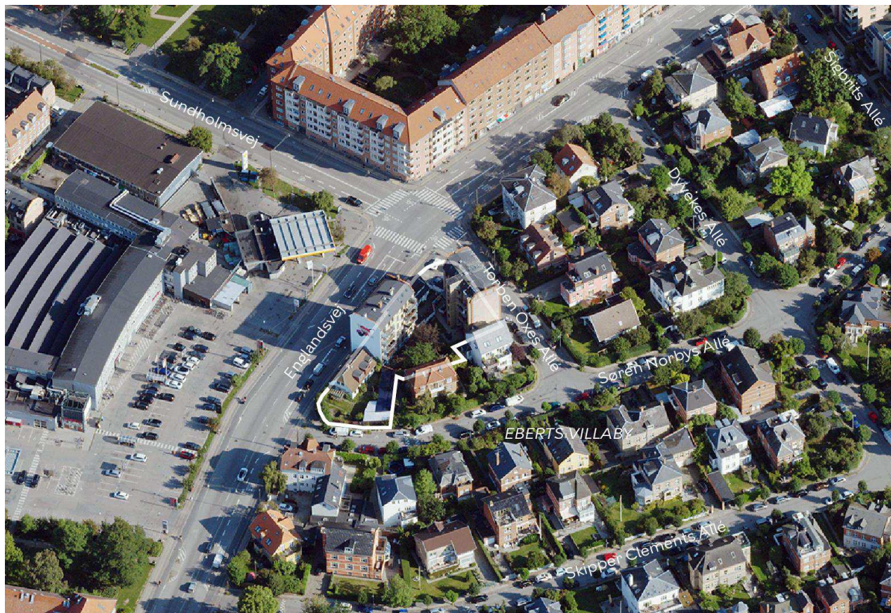
Området set mod nord. Lokalplanområdet er indtegnet med hvid linje, og de vigtigste gader er navngivet. Luffoto: SDFE Kortforsyningen, 2021.