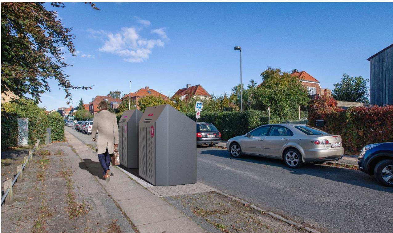
Eksempel på sorteringspunkt med to skjul. Placering samt udformning af affaldsløsninger og anlæg er ikke nøjagtig gengivelse af, hvordan et sorteringspunkt kommer til at fremstå.