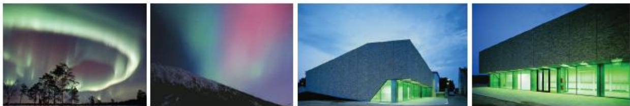
Effektivbelysning inspireret af nordlys... Rustik sten sammen med farvet lys