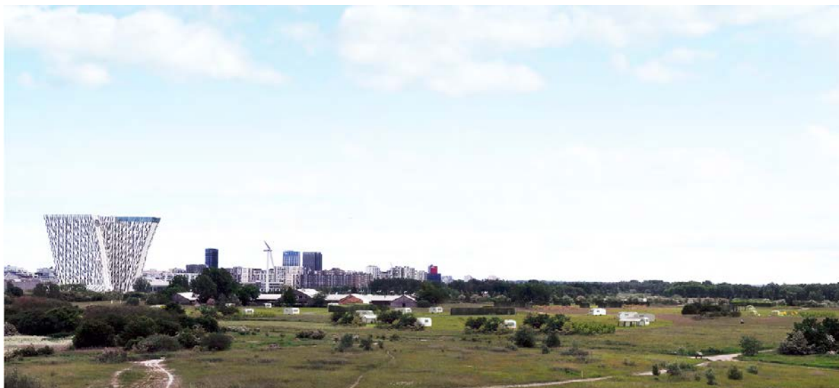
Figur 2: Visualisering af området hvor campingpladsen skal placeres.