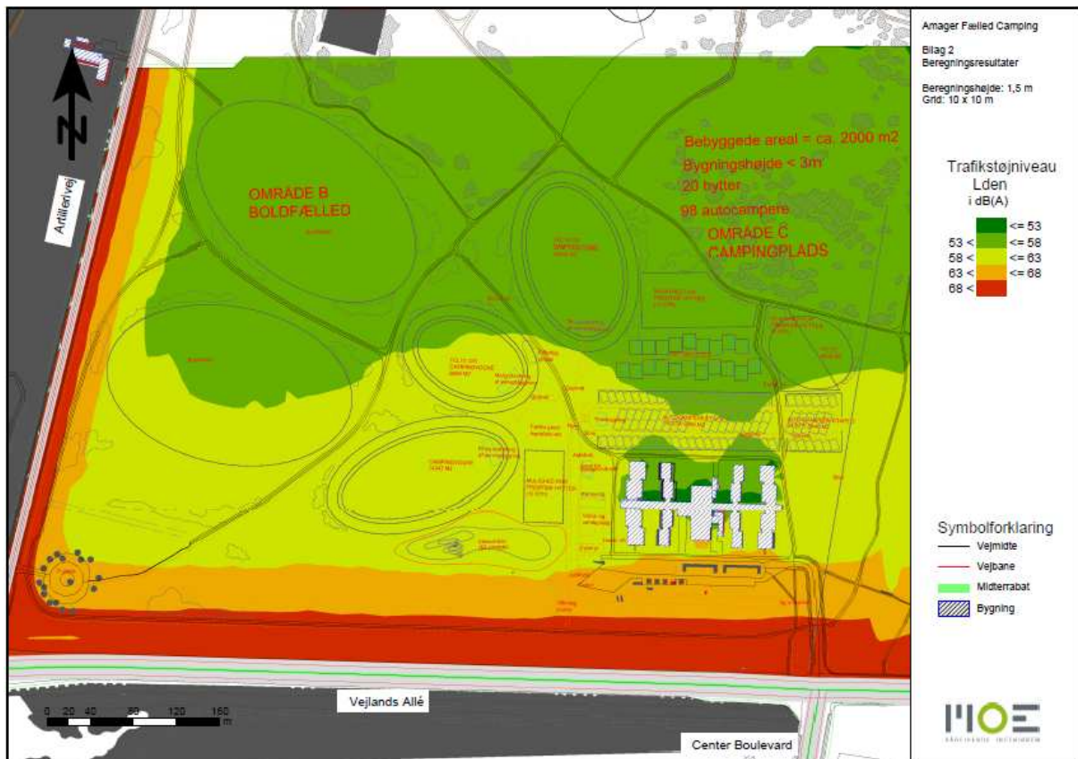
Figur 3: Støjdbredelse fra trafik nær lokalplanområdet.