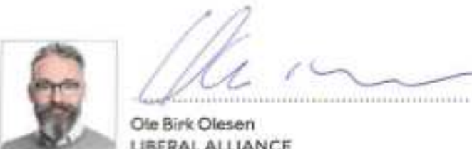
Ole Birk Olesen LIBERAL ALLIANCE