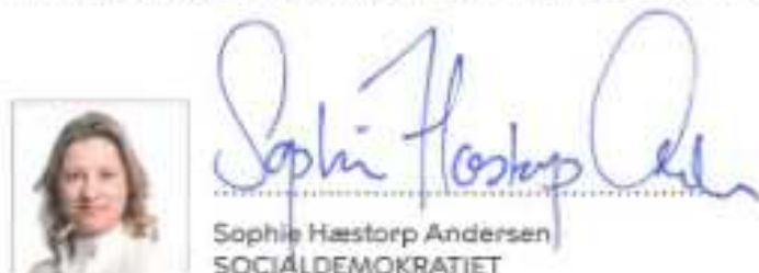
Sophie Hæstorp Andersen SOCIALDEMOKRATIET

Principaftale om budget 2024 og 2025 er indgået mellem følgende parter: